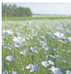
Ziel zwei: die malerische Niederrhein-Landschaft

2 Die befreiende Weite der niederrheinischen Landschaft lädt zum entspannten Radeln ein. Der Spruch „der Weg ist das Ziel“ erhält hier eine neue Erlebnisqualität und wird mit jedem Kilometer zu einer besonderen Erfahrung. Ruhe, Entspannung und Entschleunigung gehören zu den selbstverständlichen Nebeneffekten beim einsamen oder auch geselligen Fahren durch die unterschiedlichen Landschaftsformen, die von landwirtschaftlicher Nutzfläche, über Bruch- bis zu Waldgebieten reicht.