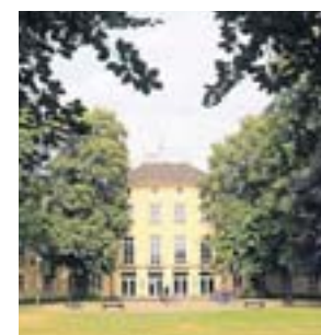
Ziel sechs: das Haus Schönwasser

6 Der langgestreckte 28 Hektar große Park mit Teich, markanten Koniferengruppen und Blutbuchen wurde 1924 angelegt und gilt als erste Volksparkanlage Krefelds. Am Endpunkt der Anlage liegt das für den Textilfabrikanten Johannes Scheibler als Landsitz errichtete Haus Schönwasser. Es hat unter anderem durch seine Gartenterrasse mit symmetrischer Treppenanlage eine barocke Anmutung. Die dachförmig geschnittenen Platanen runden das Ensemble ab. Rund um den zentral gelegenen Weiher gibt es ein langgestrecktes Wiesental, das sich zu ausgedehnten Spaziergängen eignet.