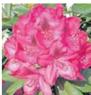
Ziel eins: der Botanische Garten

1 Mit rund 5000 Pflanzenarten aus aller Welt ist der Botanische Garten ein besonderer Anziehungsort, nicht nur bei Veranstaltungen wie „Art of Eden“. Neben dem Rosengarten mit etwa 150 Rosensorten sind die vielen Rhododendronarten ein Geheimtipp. Besonders sehenswert ist auch der Niederrheinische Bauerngarten, in dem die Beete traditionell geometrisch angeordnet und von kleinen Buchsbaumhecken gesäumt sind. Zu Figuren geschnittener Buchsbaum, Obst, Gemüse, Kräuter und Blumen fügen sich zu einem harmonischen Gesamtbild zusammen. Geöffnet ist der Botanische Garten vom 15. März bis zum 31. Oktober täglich zwischen 8 und 18 Uhr, in der Zeit vom 1. November bis zum 14. März sind die Öffnungszeiten eingeschränkt.