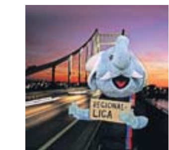
Ziel drei: Uerdingen mit seiner Rheinbrücke

3 In Uerdingen, als Heimat des ehemaligen Fußball-Bundesligisten FC Bayer legendär wie bekannt, kommt zur Lage am Rhein noch eine historische Altstadt und eine beeindruckende Industriekulisse hinzu. An keinem anderen Ort in Krefeld wird die Rolle der Industrialisierung für eine von Wohlstand geprägte städtische Entwicklung so deutlich wie hier. Die Promenade lädt zum Flanieren ein und bietet einen Blick auf den Rhein, der hier von der 860 Meter langen Uerdingen-Rheinbrücke überspannt wird.