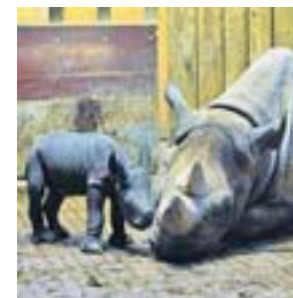
Ziel sieben: der Krefelder Zoo mit seinen Nashörnern

6 Der langgestreckte 28 Hektar große Park mit Teich, markanten Koniferengruppen und Blutbuchen wurde 1924 angelegt und gilt als erste Volksparkanlage Krefelds. Am Endpunkt der Anlage liegt das für den Textilfabrikanten Johannes Scheibler als Landsitz errichtete Haus Schönwasser. Es hat unter anderem durch seine Gartenterrasse mit symmetrischer Treppenanlage eine barocke Anmutung. Die dachförmig geschnittenen Platanen runden das Ensemble ab. Rund um den zentral gelegenen Weiher gibt es ein langgestrecktes Wiesental, das sich zu ausgedehnten Spaziergängen eignet.