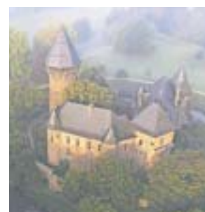
Ziel fünf: die mittelalterliche Burg Linn

4 Im Zentrum des historischen Stadtteils Linn liegt am Andreamarkt das Deutsche Textilmuseum. Darin werden in Wechselausstellungen Textilien und Bekleidung aus allen Teilen der Welt von der Antike bis zur Gegenwart gezeigt. Mit dem Andreamarkt, dem Museum und der Stadtmauer bilden die mit Kopfstein gepflasterten Altstadtgassen die richtige Kulisse für einen Rundgang durch den historischen Ortskern mit Café-Besuch. Jedes Jahr zu Pfingsten ist hier der historische Flachsmarkt.