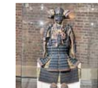
Ziel vier: das Textilmuseum mit Wechselausstellungen

3 In Uerdingen, als Heimat des ehemaligen Fußball-Bundesligisten FC Bayer legendär wie bekannt, kommt zur Lage am Rhein noch eine historische Altstadt und eine beeindruckende Industriekulisse hinzu. An keinem anderen Ort in Krefeld wird die Rolle der Industrialisierung für eine von Wohlstand geprägte städtische Entwicklung so deutlich wie hier. Die Promenade lädt zum Flanieren ein und bietet einen Blick auf den Rhein, der hier von der 860 Meter langen Uerdingen-Rheinbrücke überspannt wird.