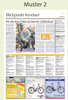
Muster 2 2 Textspalten (105 mm x 120 mm)