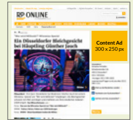
Content Ad 1 (300 x 250 px) 3 Tage in Rotation