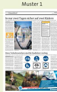
Muster 1 7 Sp. /120 mm (325 mm x 120 mm)

Im Rahmen der „RP-Radwochen“ stellen wir in unserer sechsteiligen Redaktionsserie wissenswerte Themen rund um das Thema Fahrrad vor. Die Berichterstattung läuft vom 29. April bis zum 18. Mai in den Bezirksausgaben an folgenden Terminen: Sa. 29.04., Do. 04.05., Sa 06.05., Do. 11.05., Sa. 13.05., Do. 18.05.2017. Die geplanten Themen werden sein: „Wissenswertes rund um das Thema Fahrrad“ mit Tipps zum eBike-Kauf, und Informationen zu Sicherheit, Pflege, Technik und dem richtigen Zubehör. Nutzen Sie die fachkompetente Berichterstattung als vielbeachtetes Umfeld für Ihre Werbung. Wählen Sie zwischen unseren beiden Festformaten: