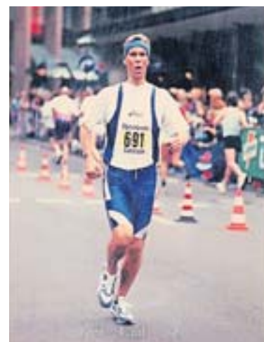
Laufen ist sein Hobby, dieses Foto zeigt ihn 1995 beim Kö-Lauf. Noack hat an insgesamt elf Marathonläufen teilgenommen, sein schönster war in London: 3:05 Stunden; Bestzeit.