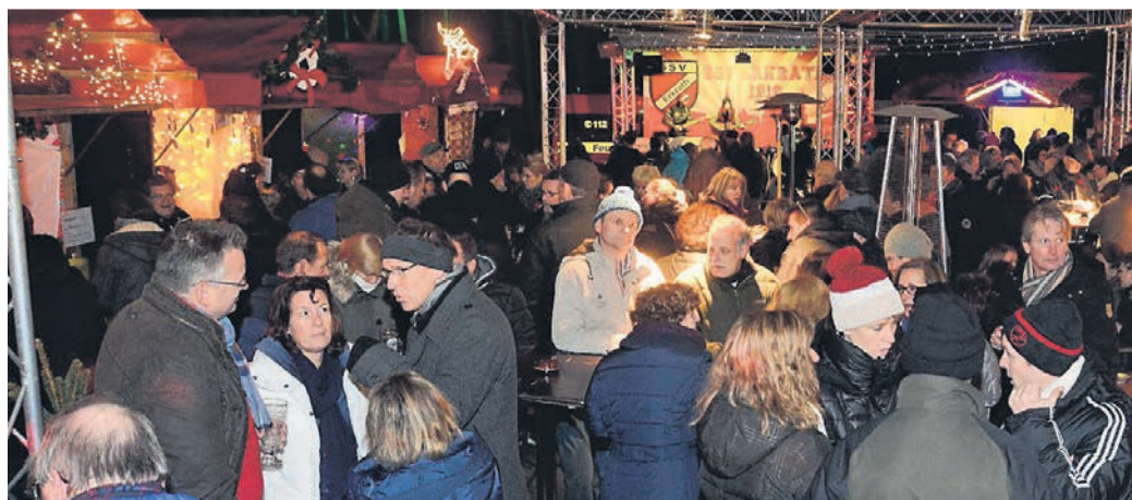
Das Weihnachtsdorf des SSV Erkrath zieht jedes Jahr zahlreiche Besucher an. Auch in diesem Jahr rechnen die Veranstalter wieder mit viel Zuspruch.

Wegen der Corona-Pandemie gilt an allen drei Tagen für die Besucher des Weihnachtsdorfs die 2G-Regel – es haben also nur geimpfte oder genesene Personen Zutritt zum Stadion. „In Absprache mit dem Deutschen Roten Kreuz wird am Samstag den ganzen Tag über ein mobiles Impfteam vor Ort sein – wir hoffen, dass sich auch viele Besucher impfen lassen werden“, sagt Fritsch. Er hoffe sehr, dass bis zum dritten Adventswochenende bezüglich der Corona-Zahlen alles gut gehe und das Weihnachtsdorf wie geplant werde stattfinden können. „Es war schon sehr schade, dass wir im Vorjahr absagen mussten. Die Menschen sprechen uns schon im Sommer darauf an, ob es im Winter das Weihnachtsdorf gibt“, sagt Fritsch.