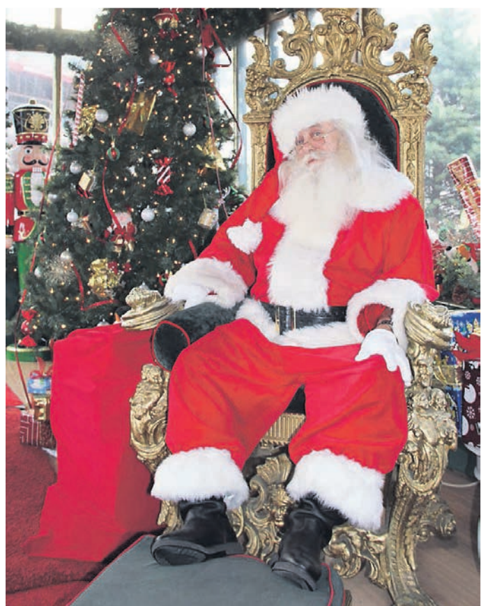
Der Weihnachtsmann freut sich immer sehr, wenn Kinder ihm Gedichte vortragen.

Denkt euch, ich habe das Christkind gesehen! Es kam aus dem Walde, das Mützchen voll Schnee, mit rotgefrorenem Näschen. Die kleinen Hände taten ihm weh, denn es trug einen Sack, der war gar schwer, schleppte und polterte hinter ihm her. Was drin war, möchtet ihr wissen? Ihre Naseweise, ihr Schelmenpack – denkt ihr, er wäre offen der Sack? Zugebunden bis oben hin! Doch war gewiss etwas Schönes drin! Es roch so nach Äpfeln und Nüssen! (Anna Richter)