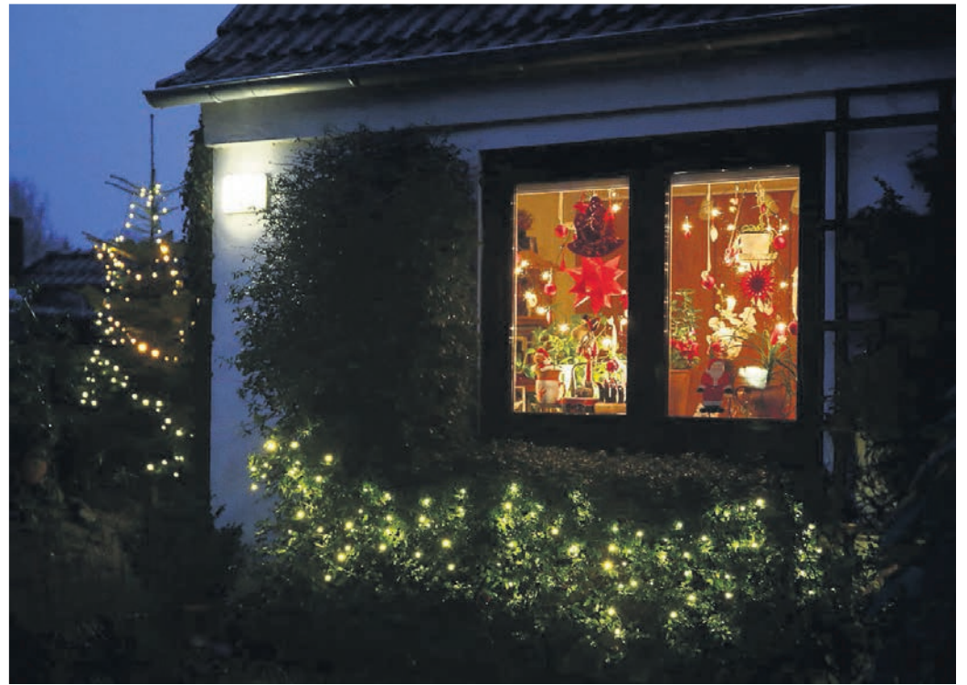
Wer Strom sparen möchte, sollte seine Lichterketten im Advent möglichst nur dann einschalten, wenn er selbst zu Hause ist.

Wer die Lämpchen zudem mit Ökostrom betreibt, kann laut dem Energieversorger Lichtblick ordentlich CO 2 -Emissionen einsparen. Ein Ausstoß von 220.000 Tonnen des klimaschädigenden