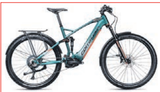
Corratec | eCrossCountry Full Suspension E-Power MTC 120 Elite