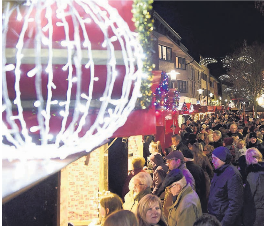
Das Lichterdorf an der Markthalle lädt alle kurzentschlossenen Weihnachtsmarktfreunde am Freitag, 26. November, in der Zeit von 18 bis 22 Uhr nach Alt-Erkrath ein.

Für Samstag, 11. Dezember, ist in der Zeit von 16 bis 21 Uhr ein Adventsabend am