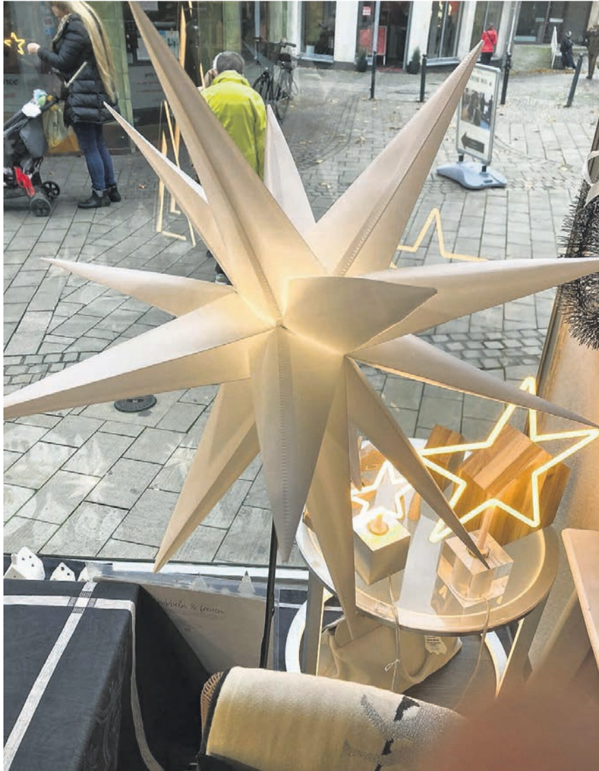
In der Adventszeit präsentieren sich die Geschäfte unter dem Motto „Wir leuchten gemeinsam“.

kunstvoll gestaltete Sterne in den Schaufenstern.