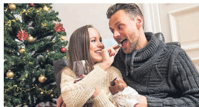
Wenn Familien Weihnachten zusammenkommen, sollten im Vorfeld die Regeln dafür geklärt werden.

Grundregel: Lieber nichts sagen Kommt es beim Thema Corona immer wieder zum Knall, sollte man es unterm Weihnachtsbaum besser meiden. „Wurden schon alle Argumente ausgetauscht, kann man es einfach dabei belassen“, sagt