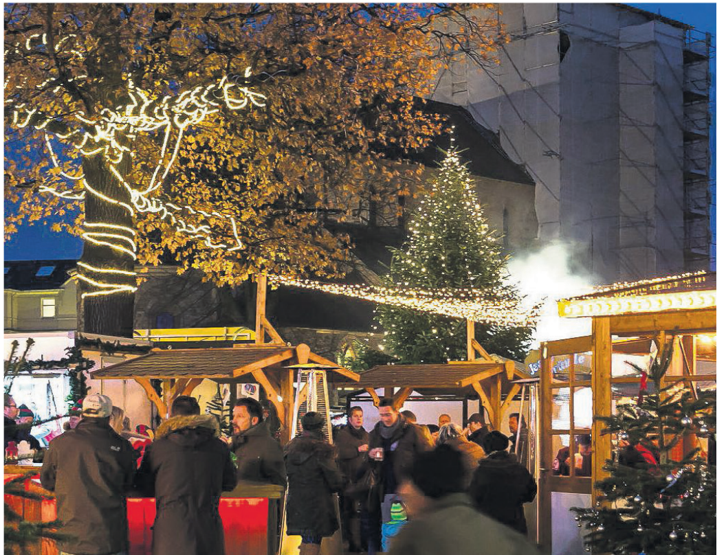
Mit dem Winterdorf sollen in diesem Jahr Geselligkeit und vorweihnachtliches Staunen in die Innenstadt zurückkehren.

Auch das Jazzorchester Muckefuck lässt sich seinen Besuch am Alten Markt nicht nehmen: Am Samstag, 18. Dezember, bringen die Musiker von 13 bis 17 Uhr Christmas-Jazz ins Winterdorf. Das Jazzorchester aus Neuss ist ein gern gesehener Gast in Hilden und lässt den Jazz der 1920er- und 30er-Jahre aufleben. In den zwanzig Jahren ihres Bestehens hat sich die Band mit ihrer Art, den Dixieland, Swing und New Orleans-Jazz zu interpretieren, vom Geheimtipp zur Jazzcombo mit Engagements