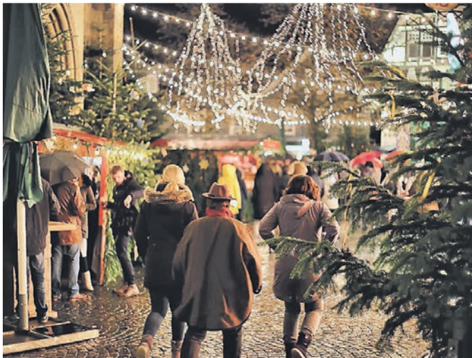
Der Blotschenmarkt lockt nach Mettmann.

Gut vorstellen kann er sich einen Auftritt des bekannten hiesigen Duos „Ernst & Miro“. „Die sind bekannt für ihre gelungenen Interpretationen der Songs von Simon & Garfunkel. Zumindest eine kleine Entschädigung dafür, dass die Simon & Garfunkel Revival-Band, die sonst immer am Schlussabend des Blotschenmarktes auf den Bühne das absolute Highlight sind, diesmal nicht in Mettmann auftreten können.“