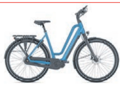
Gazelle | City eBike Chamonix C7 HMS

40885 Ratingen • Konrad-Adenauer-Platz 26 Tel. 021 02/1 01 72 02 • www.zweirad-gebel.de