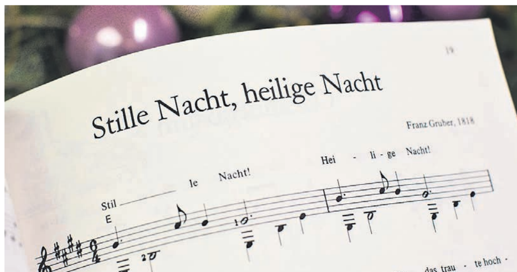
„Stille Nacht, Heilige Nacht“ gilt als das Lied der Lieder und darf an Weihnachten auf gar keinen Fall fehlen. Nicht nur in Gottesdiensten wird es gesungen.

Der Brite Chris Rea hatte 1979 die Idee zu „Driving Home For Christmas“, als er mit seiner Frau kurz vor Weihnachten auf der Heimfahrt von London in Richtung Middlesbrough im Stau stand.