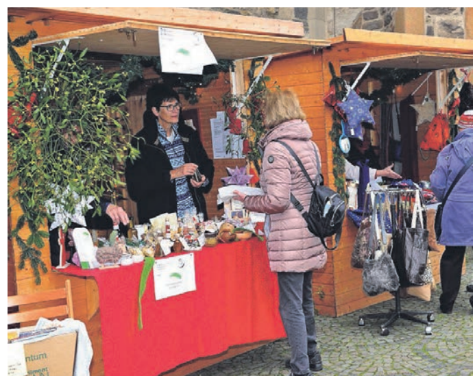
Der Weihnachtsmarkt rings um die Kirche St. Peter und Paul fällt zwar aus, dafür gibt es ein Weihnachtsdorf.

markt mit christlicher Ausrichtung rings um St. Peter und Paul. Aber das Jugendleiterrteam springt in die Bresche und lockt mit einem Weihnachtsdorf.