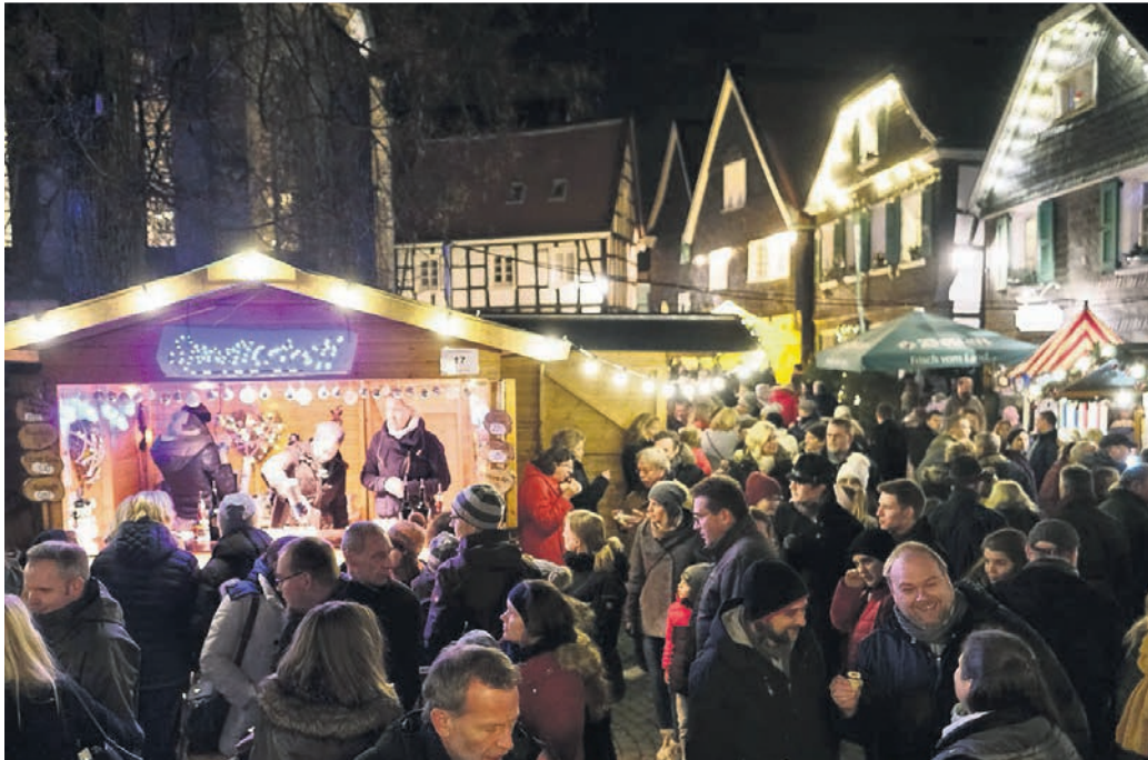
In den vergangenen Jahren war der Herzog-Wilhelm-Markt stets gut besucht.

Das fängt schon beim Betreten des Marktes an, wie Altmann ausführt: „Wir haben diesmal nur einen Zugang mit einem Euro Eintritt, an dem streng kontrolliert wird, ob die 2-G-Regelungen eingehalten werden. Wer diese Auflage nicht erfüllt, wird den HWM nicht betreten können. Wir waren uns im Vorstand einig, dass nur unter Beachtung der strengen 2-G-Regelung in diesem Jahr überhaupt unser weihnachtlicher Markt mög-