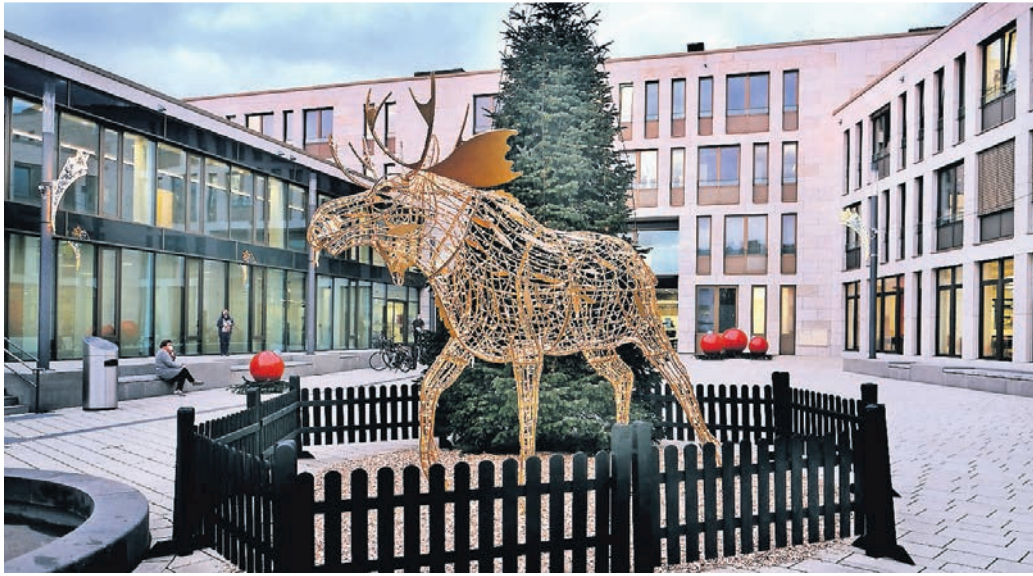
Vor dem Rathaus steht tatsächlich ein beleuchteter Elch.

Zentrale Veranstaltung bis zum 22. Dezember ist der Ratinger Weihnachtsmarkt in Kooperation mit dem Citykauf Ratingen und der Schausteller-Familie Bruch täglich von