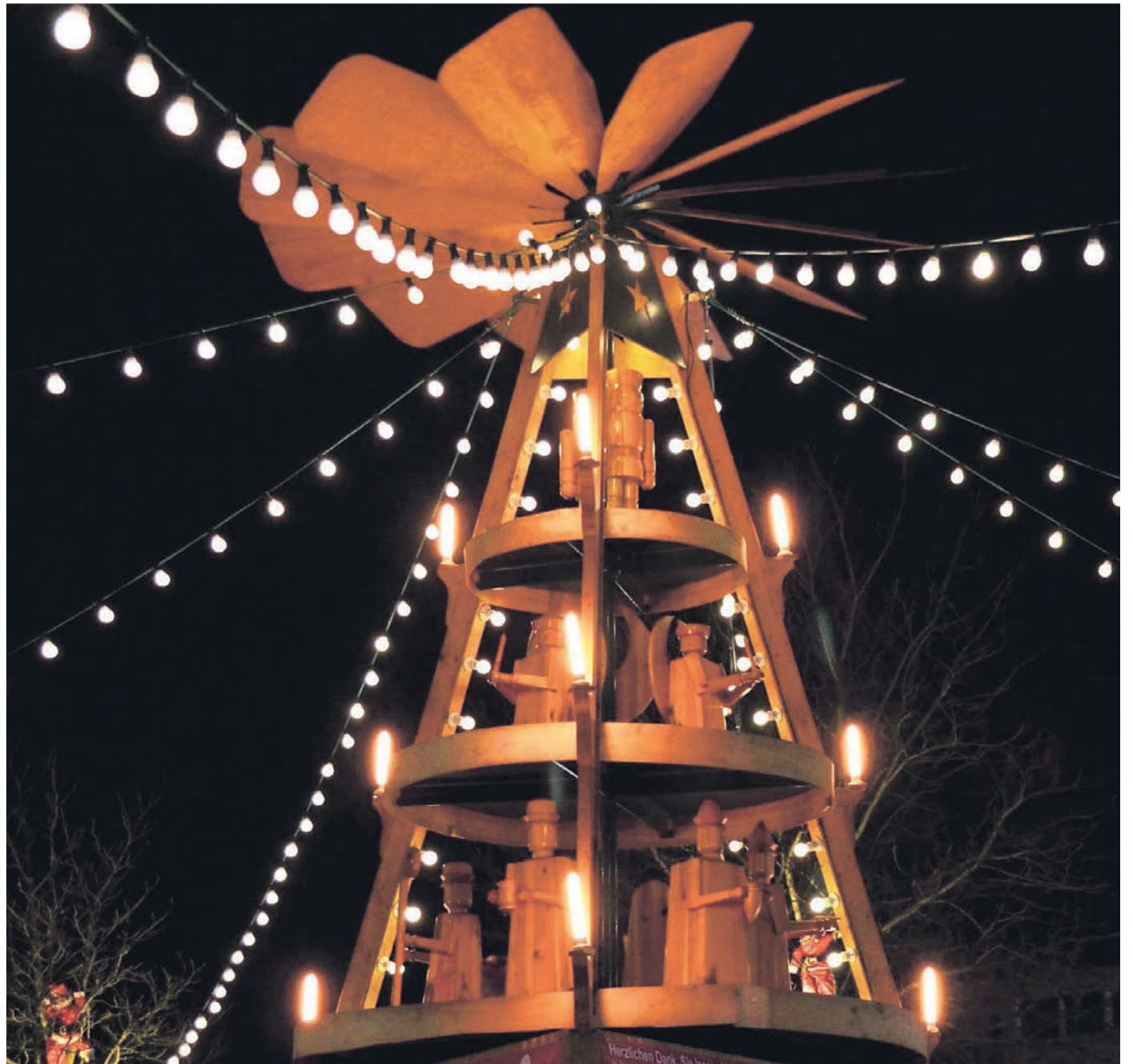
Noch bis zum 26. Dezember findet der Pyramidenmarkt in Haan statt. Er ist der kleinste Weihnachtsmarkt in NRW.