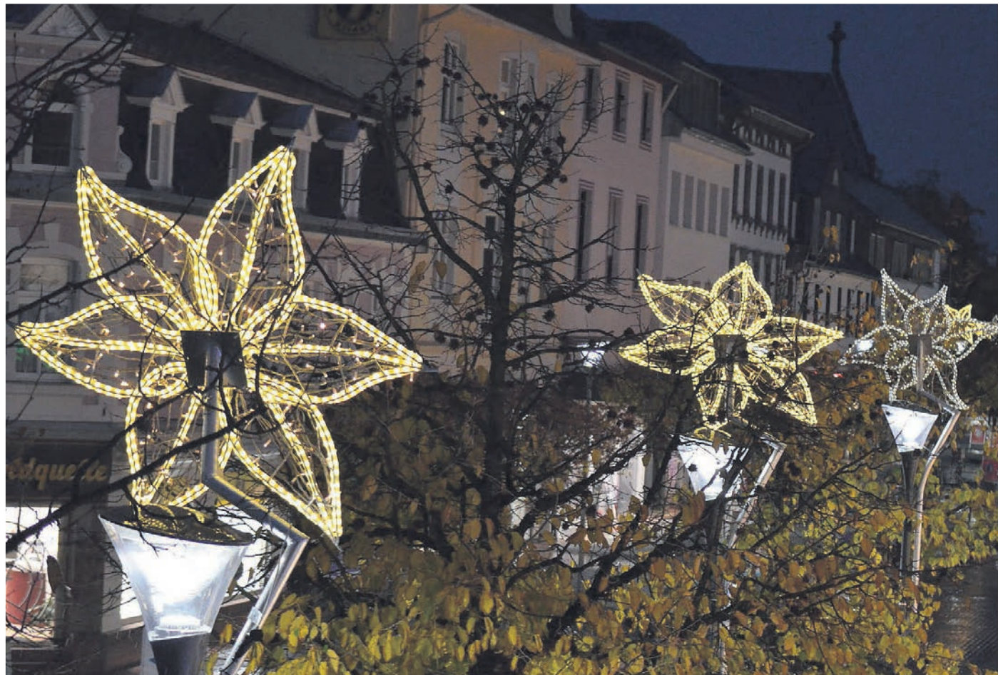
So schön leuchten die Sterne in der Hildener Innenstadt.

Genau 100 Weihnachtssterne leuchten bereits in der Innenstadt in Hilden. Eigentlich sollten die Winterlichter den großen und beliebten Weihnachtsmarkt flankieren, den das Stadtmarketing ausrichtet. Aber eine Woche vor dem Stadtschuss beschlossen Stadtmarketing, heimische Vereine und Stadt dann doch die Absage. Viele beteiligte Gruppen hätten kein gutes Gefühl gehabt, trotz steigender Inzidenzzahlen beim Weihnachtsmarkt dazu zu sein, hieß es beim Stadtmarketing. 2G-Kontrollen wären durch die Lage