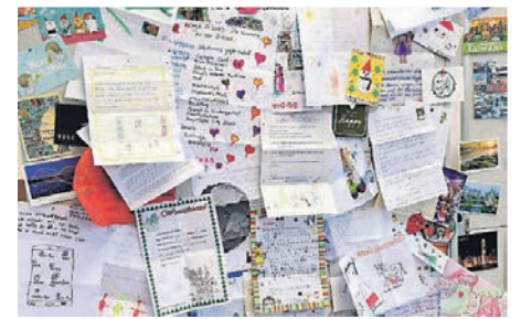
Viele Briefe an den Weihnachtsmann gehen an die falsche Adresse.

Nach den Festtagen möchte man sofort eine Diät machen. Dabei ist alles nur halb so schlimm. 370 Gramm nimmt man laut einer Studie des amerikanischen National Institute of Health bei der Schlemmerei an Weihnachten nur zu.