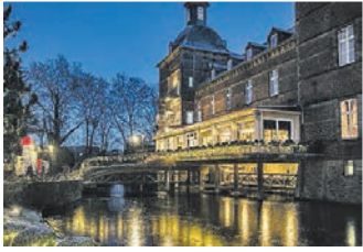
Das Schlosshotel Hugenpoet in Essen-Kettwig

Nach einer Zwangspause am 2020 findet der Nikolausmarkt im Schloss Hugenpoet wieder an zwei Wochenenden statt. Vom 26. bis 28. November und vom 3. bis 5. Dezember erstrahlt das Wasserschloss zum 12. Mal im weihnachtlichen Glanz. An drei Tagen präsentieren sich rund 50 Aussteller und zeigen Kunsthandwerk, Schmuck, Feinkost und besondere Geschenkideen. An schön dekorierten Hütten und einzelnen schneeweißen Pagoden können die Besucher träumen, Schönes bestaunen, Köstlichkeiten genießen und einfach nur entspannen. Das Schloss wird illuminiert, weihnachtliche Klänge ertönen, und die Luft duftet nach Glühwein.