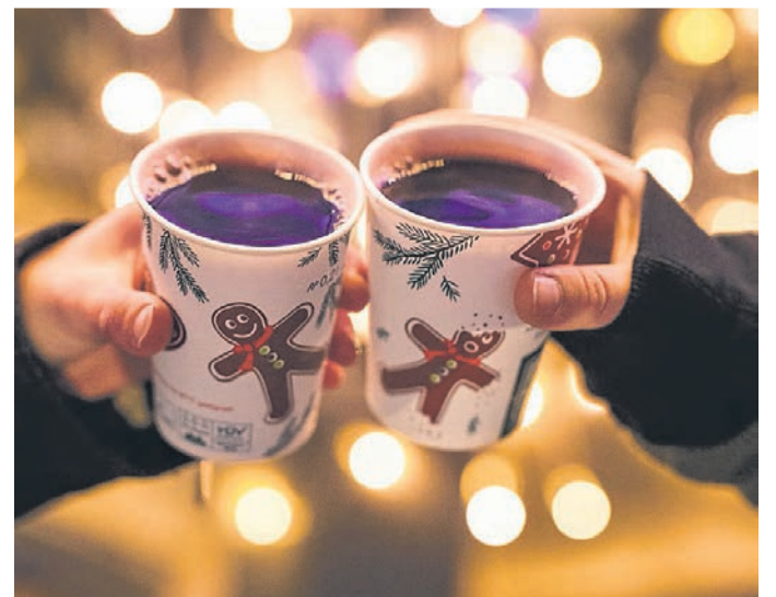
Natürlich darf auf einem Weihnachtsmarkt auch ein leckerer Glühwein nicht fehlen.

Das erste Konzert wird vom Sinfonieorchester in Kooperation mit dem Gymnasium Hochdahl in der dortigen Aula veranstaltet. Zum zweiten Termin spielen die Musikklassen zusammen mit dem Gymnasium Hochdahl, ebenfalls in der Aula. Die Uhrzeiten standen bei Redaktionsschluss noch nicht fest, können aber auf der Webseite der Stadt Erkrath im Veranstaltungskalender eingesehen werden.