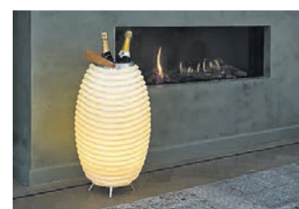
Lampe KooDuu ist auch ein Weinkühler.

Wer gerade nicht das Budget für ein nagelneues Gerät hat, sollte unbedingt nach Gebrauchtgeräten fragen, die Rüdiger Guhl selbstverständlich erst nach gründlicher Kontrolle auf die Verkaufstheke