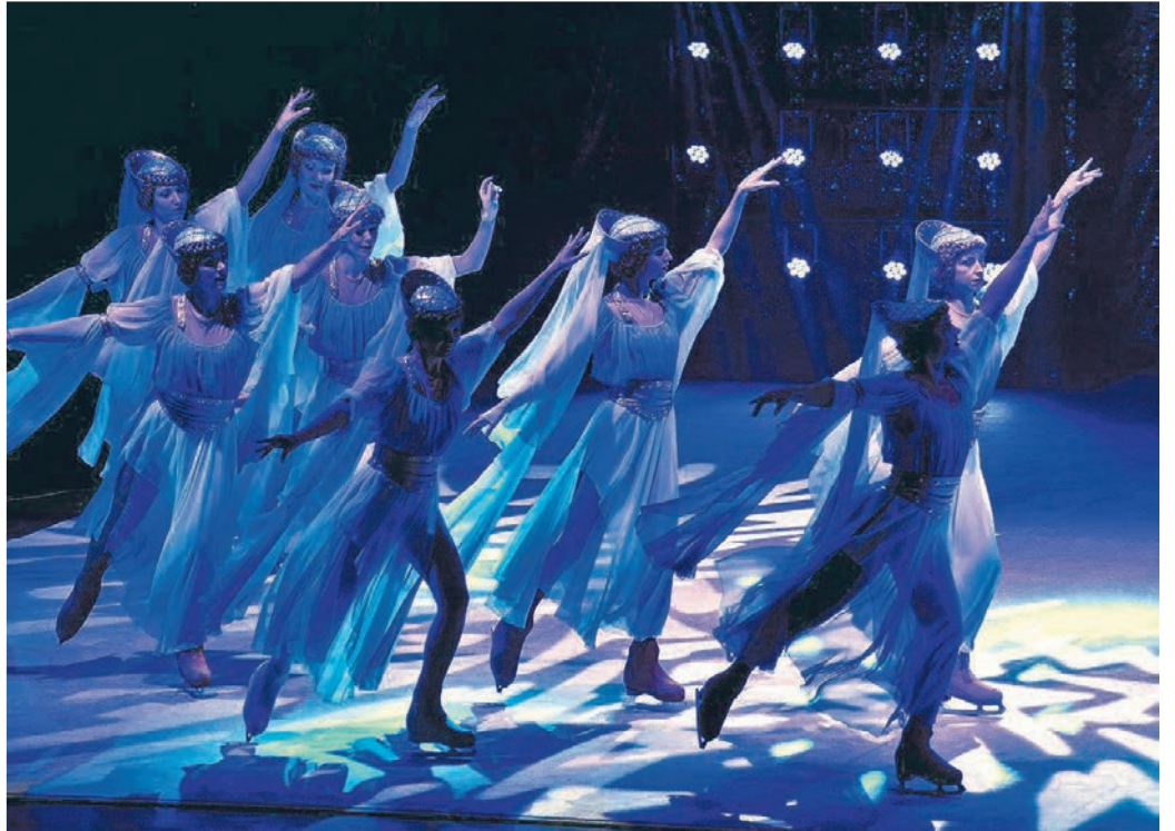
Der Circus on Ice gastiert einen Tag vor Weihnachten in der Stadthalle.