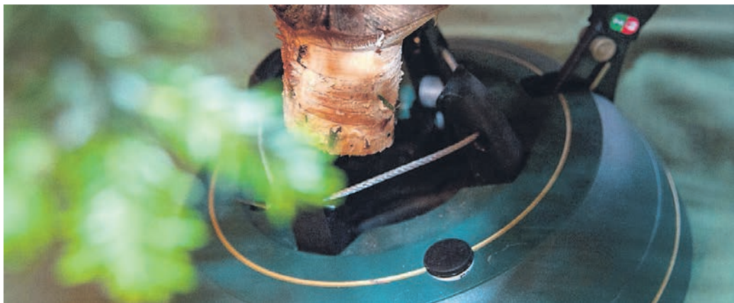
Zu empfehlen sind Christbaumständer, die sich mit Wasser füllen lassen. So bleibt der Weihnachtsbaum länger frisch und fängt nicht früh an zu nadeln.

Am besten holt man den Baum erst spät an seinen späteren Bestimmungsort und lagert ihn vorher kühl, trocken und windgeschützt, entweder draußen oder in der Garage, im Keller oder im Treppenhaus. Auf gar keinen Fall darf der Baum im Wohnraum in unmittelbarer Nähe einer Heizung stehen.