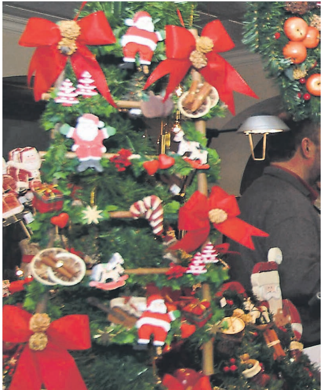
Beim Weihnachtsmarkt im Lokschuppen sind lauter nichtgewerbliche Anbieter, die vor allem Selbstgemachtes anbieten – kunsthandwerklich und kulinarisch – mit dabei.

Auf dem Außengelände werde es vor allem kulinarische Stände geben. „Natürlich wird es auch unsere beliebte Lokschuppen-Bratwurst geben“, sagt Fellenberg schmunzelnd – dazu natürlich Glühwein, Punsch und andere Leckereien. „Dann ist von der Feuerwehr Erkrath der Löschzug Trills mit einem Stand vertre-