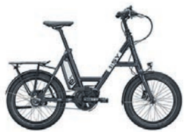
i:SY | eKompaktrad DrivE N3.8 ZR

E-Räder: NEUE LIEFERUNG Große Auswahl 2022 Modelle