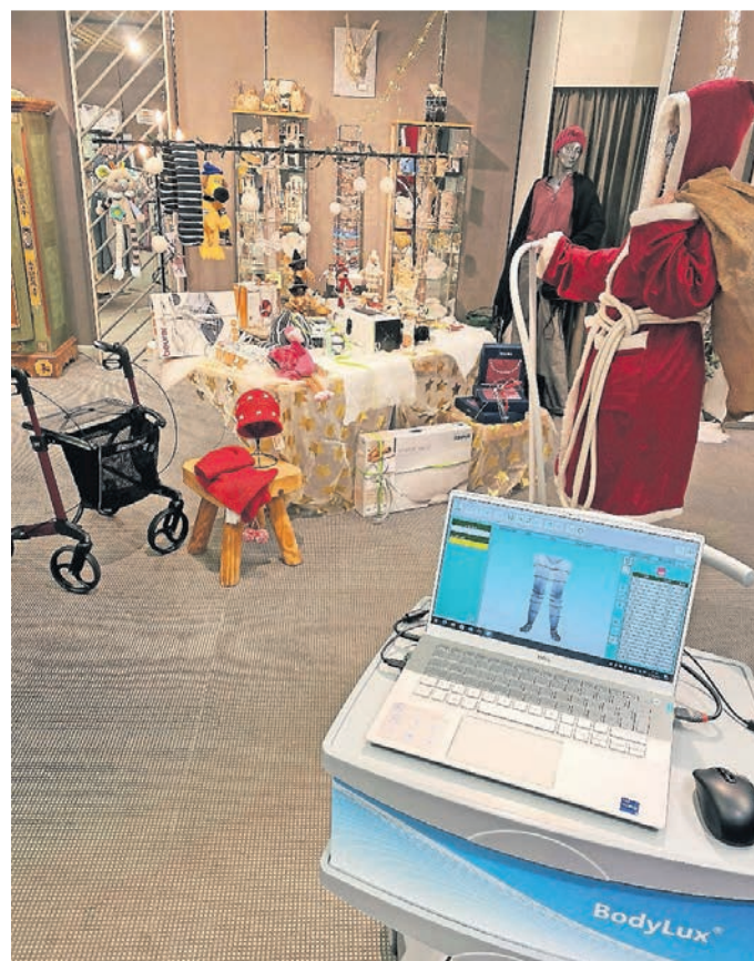
Im Sanitätshaus Kreutzer wird nicht nur der Nikolaus in der Weihnachtszeit fündig.

Und wenn es mal etwas anderes unterm Tannenbaum sein darf, hat das Lennep Sanitätshaus viele passende Geschenkideen: „Blutdruckmessgeräte, Massagegeräte, Wärmekissen, Schlafanzüge und Frottierwäsche sind dieses Jahr sehr begehrt. Ebenso unsere Räuchermännchen aus dem Erzgebirge“, nennt Kris-