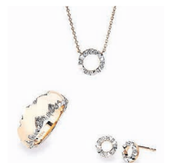
Die Alpenring-Kollektion ist mit vielen Brillanten besetzt.

ten lebendig funkeln. Collier, Ohrstecker, Ring und Armband gibt es in 18-karätigem Gelb-, Weiß- und Roségold. Das Textilarmband mit Zugverschluss gibt es in vielen weiteren Farben. Es lässt sich leicht an- und ausziehen und an das eigene Handgelenk anpassen. „Die Textilbänder ziehen sich der-