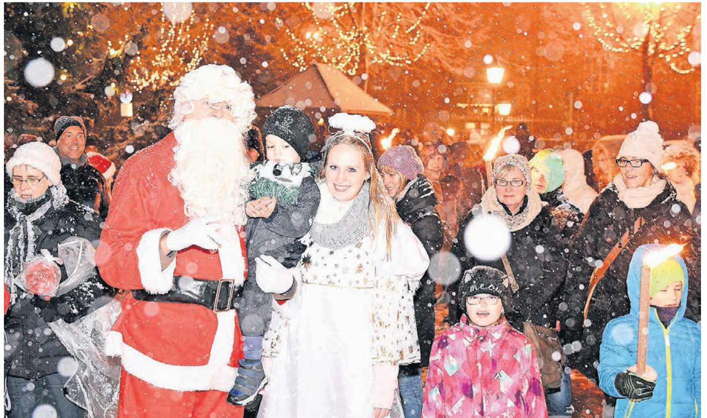
An der schönen Tradition des Fackelzugs mit dem Nikolaus und Christkind möchten die Organisatoren des Hüttenzaubers festhalten, wenn die Corona-Situation es erlaubt.

Wenn auch der Weihnachtsmarkt in diesem Jahr erstmal am Schloss stattfindet, so lädt auch der Rest der Altstadt zum Bummeln ein. Das Kultur-Haus Zach öffnet am Samstag und Sonntag seine Kulturmesse mit weihnachtlichem Angebot von Künstlern aus der Region. Die Händler in der Innenstadt laden am Sonntag, 5. Dezember, von 13 bis 18