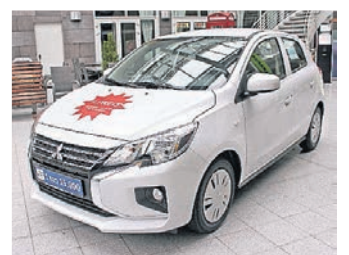
Im Glasfoyer am Bahnhofplatz ist der Mitsubishi bereits ausgestellt.

Zudem gibt es in der Adventszeit wieder drei Zwischenziehungen am Wilhelmplatz: Samstag, 27. November,