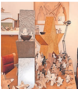
Sterne in allen Größen sind ausgestellt.