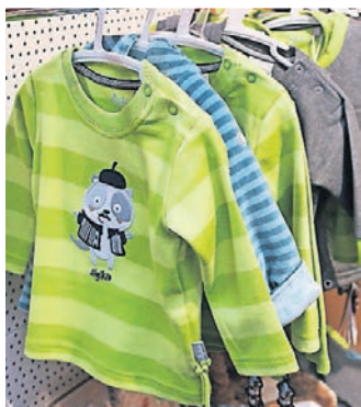
Die neue Baby mode von Sigikid und S.Oliver ist da.