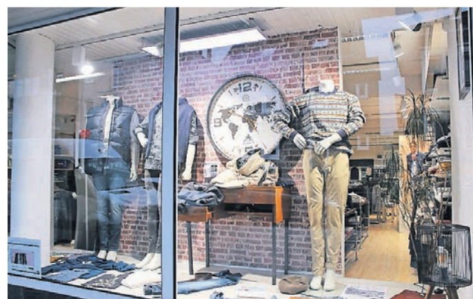
Die Wanduhren im Schaufenster von Male sind nicht nur Deko.

Echte Hingucker sind auch die Schuhe von Jack & Jones, die das Outfit erst so richtig