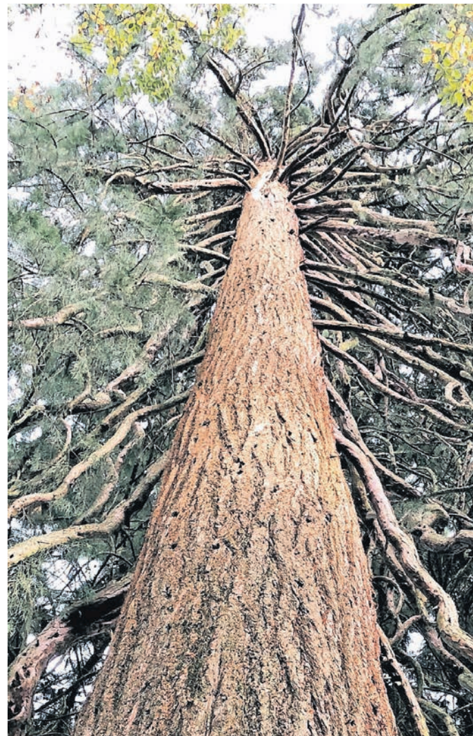
Dieses Exemplar eines Mammutbaums steht im Stadtpark. Es ist nur einseitig beastet.