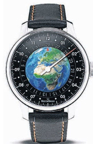
Die Edition „Planet Earth“ unterstützt die Arbeit des WWF mit 200 Euro pro Uhr.

Neuheiten gibt es beim Uhrenhersteller Meistersinger. Mit der auf 500 Exemplare limitierten Edition „Planet Earth“ soll die weltweite Arbeit des WWF unterstützt werden. Die Organisation setzt sich für den Erhalt der biologischen Vielfalt der Erde ein, fördert die nachhaltige Nutzung natürlicher Ressourcen und hilft Umweltverschmutzung und verschwenderischen Konsum zu reduzieren. Das Modell „Planet Earth“ wird an einem veganen Armband aus Apfelfasern getragen, das in Qualität und Optik sowie beim Tragekomfort kaum von echtem Leder zu unterscheiden ist. Ein eigens für diese Uhr konzipiertes Etui aus nachhaltiger Produktion rundet das Konzept der Edition ab. „Diese Automatik-Uhr ist schon etwas ganz Besonderes“, sagt Marc Hähner.