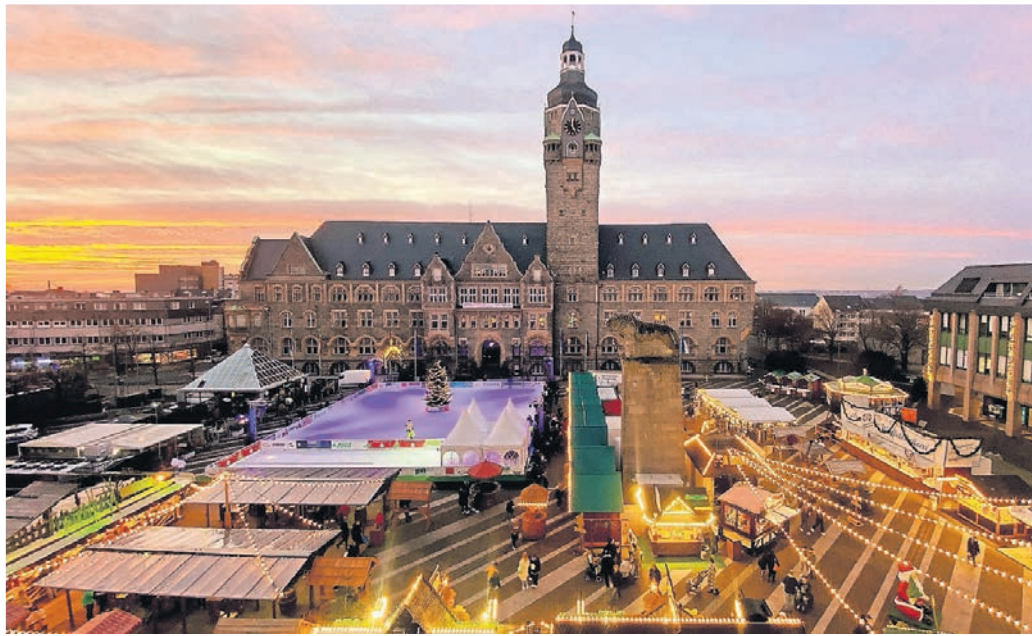
Der Weihnachtstreff leuchtete bei der Eröffnung mit dem Abendhimmel um die Wette.

Alle Jahre wieder verwandelt sich der Remscheider Rathausplatz in einen Weihnachtstreff. Am Eingang leuchtet eine riesige Sternschnuppe mit dem Schriftzug: „Herzlich Willkommen“. Das Rathaus erstrahlt in Festbeleuchtung, während Kinder, Jugendliche und Erwachsene auf der 600 Quadratmeter großen Eisfläche vergnügt ihre Runden drehen. Ringherum stehen weihnachtlich geschmückte Hütten, die Glühwein, Bratwurst, Champignons und Reibekuchen verkaufen – genau so, wie man es von einem echt Bergischen Weihnachtsmarkt erwartet.