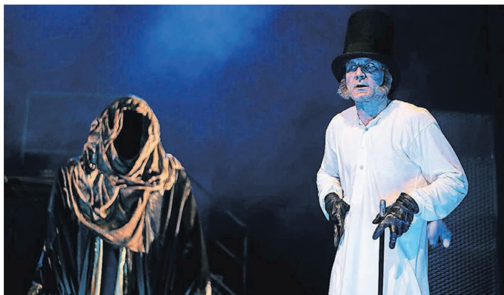
Eine Weihnachtsgeschichte nach Charles Dickens.

Eine Übersicht über das Angebot des Radevormwalder Juwelier- und Uhrenfachgeschäfts an der Kaiserstraße bietet der Katalog, der der Tageszeitung beiliegt.