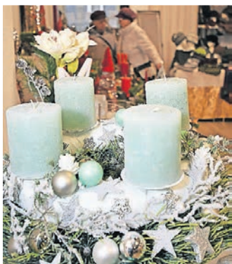
Die 24. Kulturmesse wird weihnachtlich.