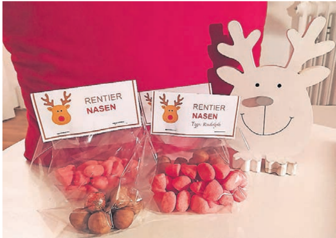
Die Nasen von Dasher, Dancer, Prancer, Vixen, Comet, Cupid, Donner, Blitzen und Rudolph in süßer Variante.

Diese Bastelidee ist schnell gemacht und sorgt immer für ein fröhliches Lächeln bei den Beschenkten.