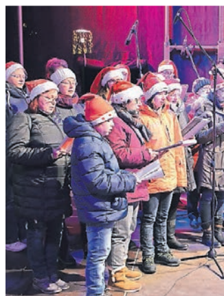
Das Weihnachtssingen hat lange Tradition.

Radevormwald lädt zum Shoppen, Weihnachtsmarkt und gemeinsamen Singen ein.