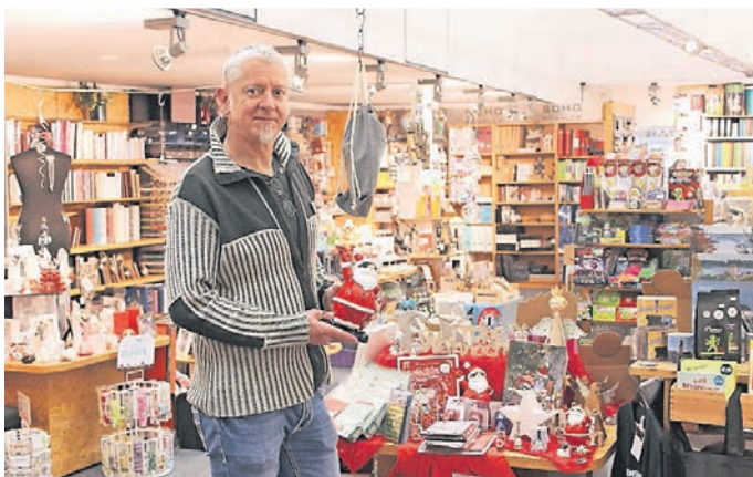
Im Laden von Harro Schmidt wimmelt es nur so von guten Geschenk- und Wichtelideen zur Weihnachtszeit.

Im Schreibwaren-Fachgeschäft Gottlieb Schmidt gibt es viele schöne Kleinigkeiten, um Kindern, Eltern, Großeltern, dem Partner oder der Partnerin das Warten auf Weihnachten liebevoll zu verkürzen. Auch Ideen für den Wichtelsack oder für ganz persönliche Geschenke zählen dazu. Das reicht vom Knusperhaus zum selber basteln über Männeradventskränze und Wundertüten