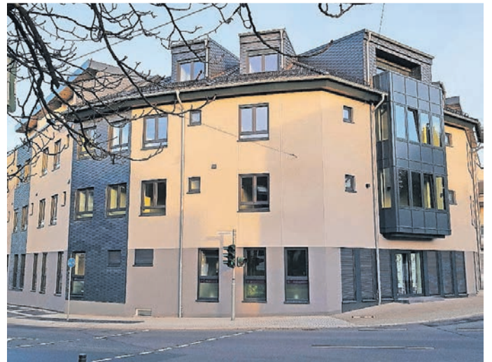
Im Erdgeschoss stehen der Diakoniestation 375 Quadratmeter zur Verfügung. Die WGs haben die oberen Etagen bezogen.