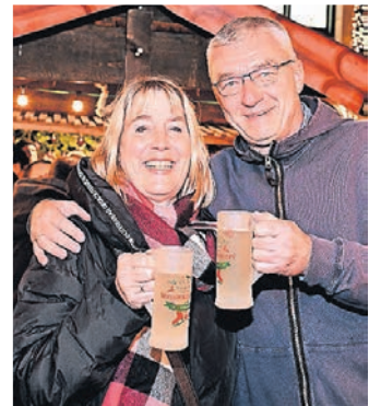
Ein Heißgetränk darf auf dem Markt nicht fehlen.

Kontrolliert werden nun die Geimpften und Genesenen mittels Armbändchen, die an