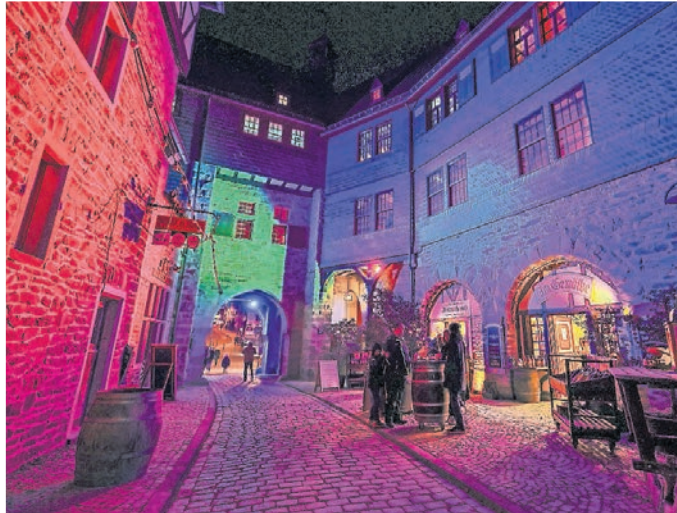
Schon der Eingang erstrahlt in buntem Licht.

Über 500 Scheinwerfer und mehrere Kilometer Kabel sind nötig, um die Burg spektakulär in Szene zu setzen. Eingebunden sind der Bergfried, der Innenhof und das Grabentorgebäude, wobei der Besucher bereits beim Betreten des Zwingerhofs mit