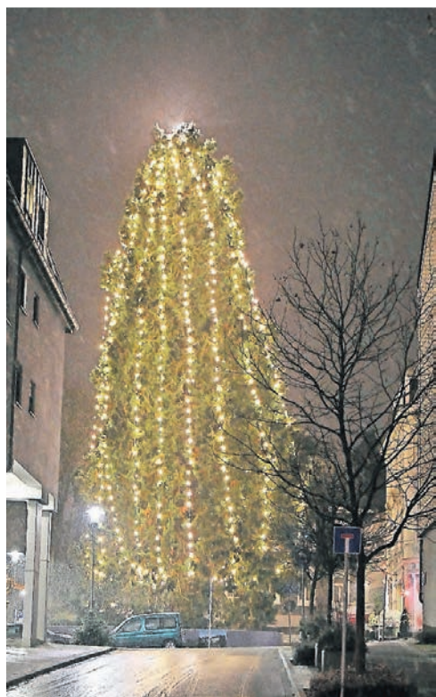
Der größte Naturweihnachtsbaum Deutschlands steht an der Carl-Leverkus-Straße.

Es gibt sechs prächtige Mammutbäume in Wermelskirchen – darunter auch der höchste innerstädtische Natur-Weihnachtsbaum Deutschlands.