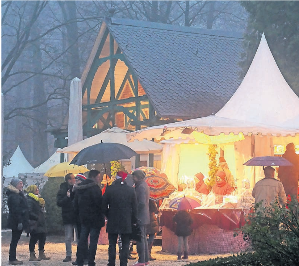
Die festlich beleuchteten Zelte des Weihnachtsmarkts auf dem Gelände von Schloss Grünewald bezaubern jedes Jahr viele Besucher. 2021 fällt der Markt jedoch aus.