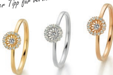
Swing „BoHo“ XS

Filigran und dennoch verspielt. Der 360° frei bewegliche Diamant macht die Swing Collection faszinierend lebendig.