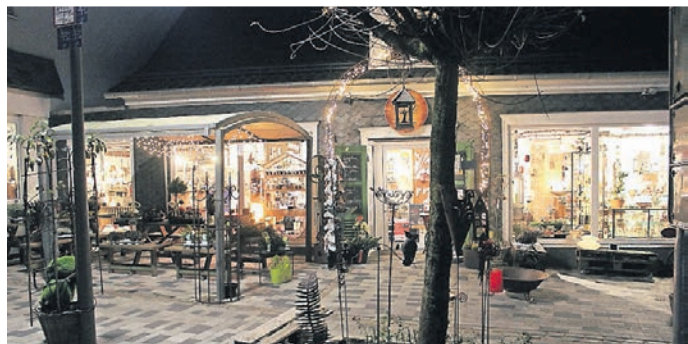
Die stimmungsvolle Beleuchtung lädt zum Stöbern ein.