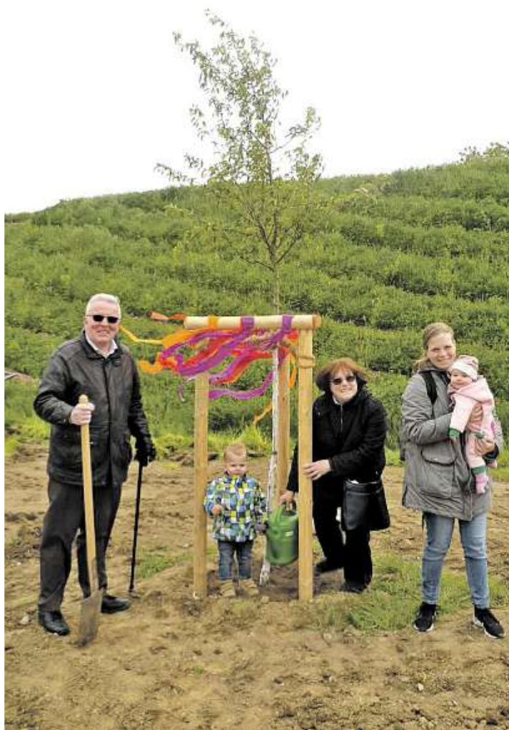
Diese Kempener Familie spendete einen Baum anlässlich der Taufe des jüngsten Kindes.

Wie jeder Hobbygärtner weiß, umfasst die Pflanzzeit in unseren Breiten das Frühjahr und den Herbst mit den Spiel-räumen, die der Klimawandel noch geben mag. Wer jetzt schnell einen Baum zu einem besonderen Anlass in die Erde gesetzt bekommen möchte, muss sich sputen. Die Pflanzzeit endet am 1. April, weiter geht es dann erst wieder ab Mitte Oktober. Es ist auch möglich, dass der Baumspender und der/die Beschenkte an der Pflanzaktion teilnehmen können. Das