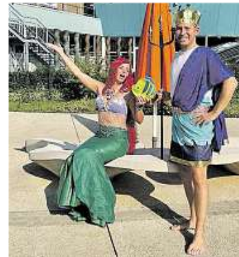
Das Team Blade Runnerzzzz gewann die letzte Scavenger Hunt. Tolle Kostüme gehörten zu den Aufgaben.

Den Gewinnern winken neben dem Spaß Preise im Gesamtwert von rund 2500 Euro, unter anderem Gutscheine aus dem Einzelhandel, für Veranstaltungen, aber auch Sachpreise. Die Siegerehrung ist im Rahmen des Feierabendmarktes am 26. Mai geplant. Anmeldungen sind ab etwa vier Wochen vorher in der App