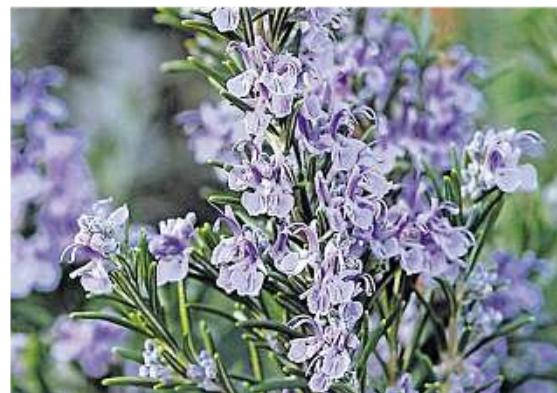
Rosmarin bildet schon früh hübsche Blüten, meist in einem Blau- oder Lilaton.

Informationen zum aktuellen Gartenwetter mit Empfehlungen etwa zum Bewässern oder Rasenschneiden gibt der Deutsche Wetterdienst auf seiner Homepage www.dwd.de