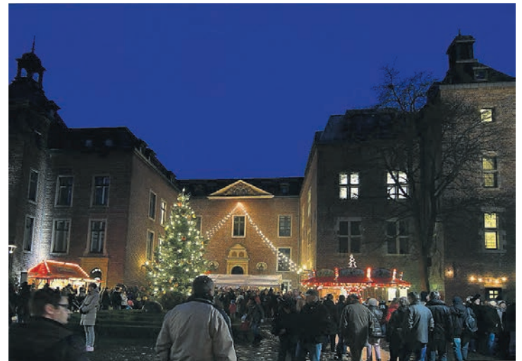
Der Weihnachtsmarkt an Schloss Neersen ist besonders stimmungsvoll.

In diesem Jahr neu dabei sind unter anderem ein Hersteller von Glasperlen