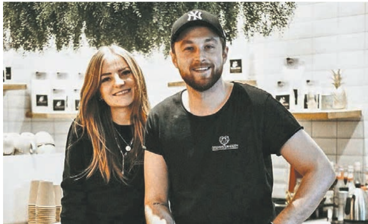
Das Café Geschwisterherzen verwöhnt mit hausgemachten Köstlichkeiten wie beispielsweise vegetarischen Spinatknödeln.