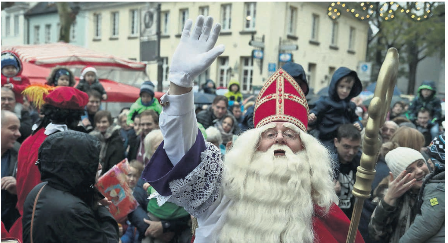
Sinterklaas kommt nach Uerdingen. Mit dabei sind seine Pieten und die Koninklijk Philharmonisch Gezeischap.