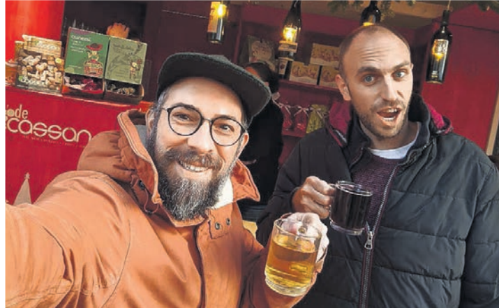
Glühwein, Punsch, Eierlikör und mehr hat DeCassan Weinhandel & Weinbar auf dem Weihnachtsmarkt im Angebot.