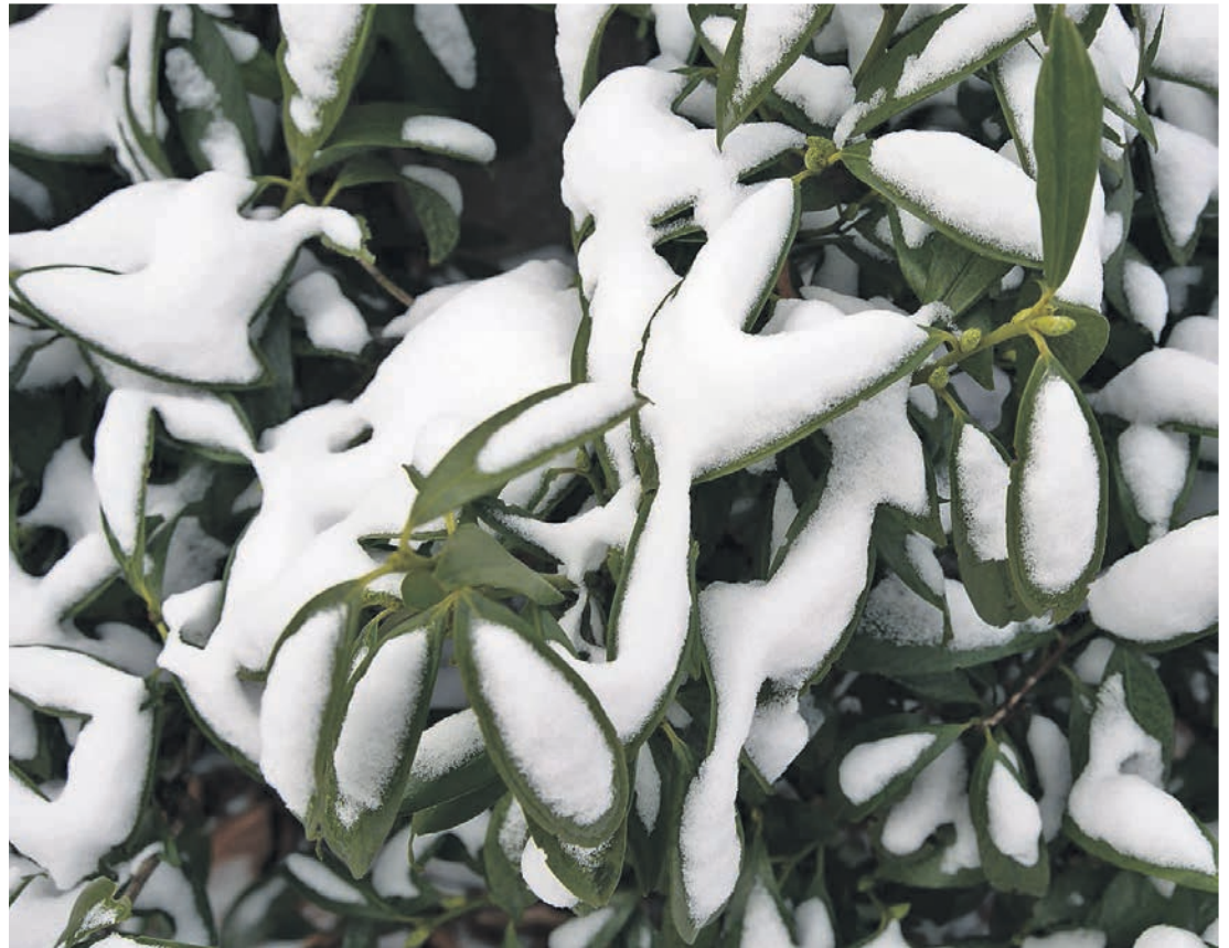
Pflanzen wie der Kirschlorbeer spielen im Winter häufig eine Hauptrolle im Garten.

Eine Ergänzung oder Alternative zu Wegen und Treppen sind immergrüne Pflanzen.