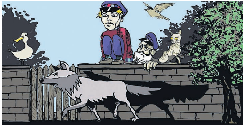
ZEICHNUNG: PETER SCHMITZ

Premiere: Samstag, 26. November, 16 Uhr. Weitere Termine: So, 11.12., 11 Uhr; So, 18.12., 11 Uhr; Mo, 26.12., 15 Uhr