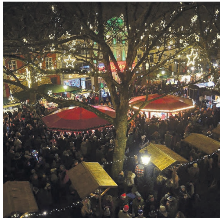
Im vorweihnachtlich geschmückten Kempen bummelt es sich gut.