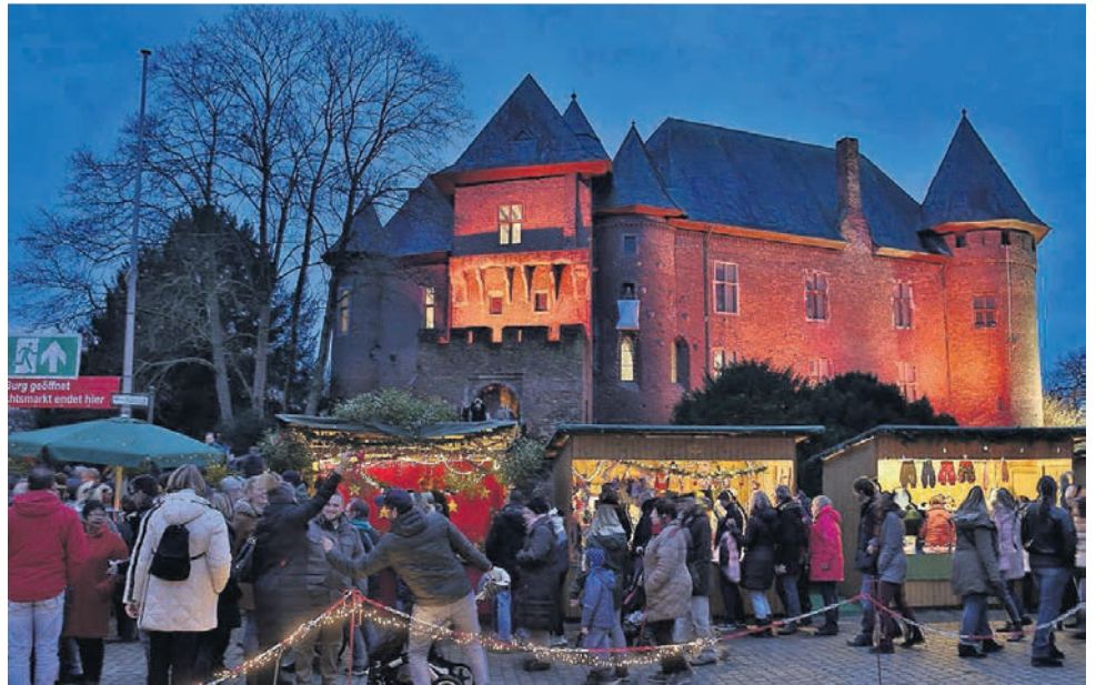
Der Weihnachtsmarkt auf Burg Linn versprüht historischen Charme.

Doch ohne den Einsatz der Linner wäre der Markt gar nicht möglich. Mit dabei ist in diesem Jahr bestimmt wieder die 1. Schützenkompanie, die traditionell für Grünkohl samt Weihnachtsschwein sorgt. Und wahrscheinlich kehren auch