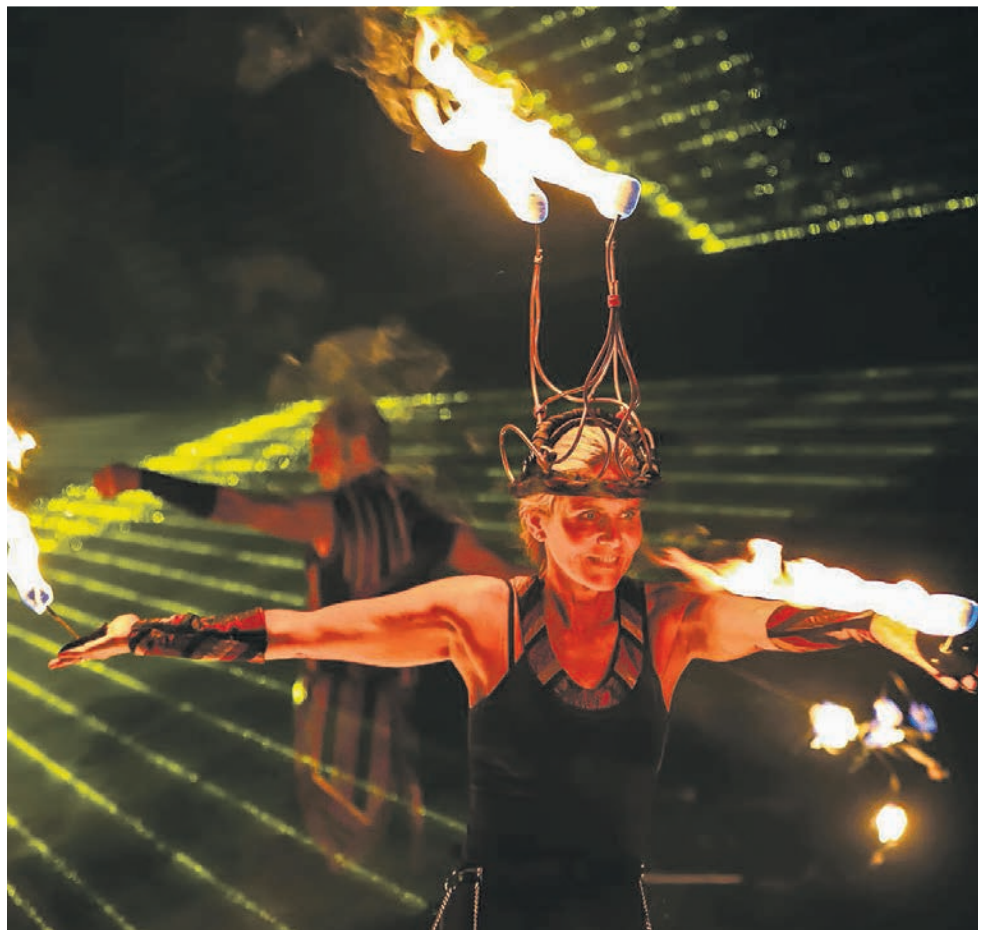
Faszinierend: An gleich vier Standorten treten Feuerkünstler aus.

Zwischen 17 und 21 Uhr ziehen die artistischen Stelzenläufer als beleuchtete Walking Acts durch die Innenstadt, in der über 100 LED-Sterne ihr warmes Licht