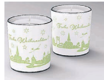
Die Grefrather Weihnachtskerze wird für den guten Zweck verkauft.

meinschaft Grefrath InTakt haben eine personalisierte „Grefrather Weihnachtskerze“ produzieren lassen. Der Gewinn nach Abzug der Herstellungskosten soll an die Grefrather Tafel gehen. Die Kerzen werden für fünf Euro beim Weihnachtszauber und in verschiedenen Grefrather Geschäften verkauft.