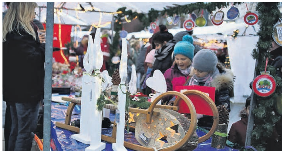
Der besondere Weihnachtsmarkt gehört für viele Krefelder und Gäste aus der ganzen Region zu den Höhepunkten der Adventszeit.

Er selbst freut sich das gesamte Jahr auf den Morgen, wenn er endlich zum Weihnachtsmarkt fahren kann. „Ich kann das kaum in Worte fassen. Aber dieses Leuchten in den Augen der Menschen, die alle da sind, um gemeinsam Geld für einen guten Zweck zu verdienen – das ist etwas ganz Außergewöhnliches.“ Alle Vereine und Gruppen, die ihre Waren auf dem Besonderen Weihnachtsmarkt anbieten, kommen aus dem