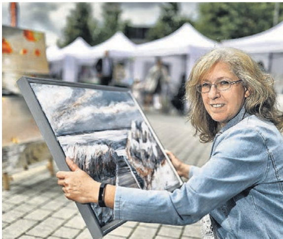
In der Vergangenheit gab es auf der Kunstmeile viele sehr unterschiedliche Arbeiten zu bestaunen. Die Bewerbungsphase für dieses Jahr läuft noch bis zum 27. Mai.