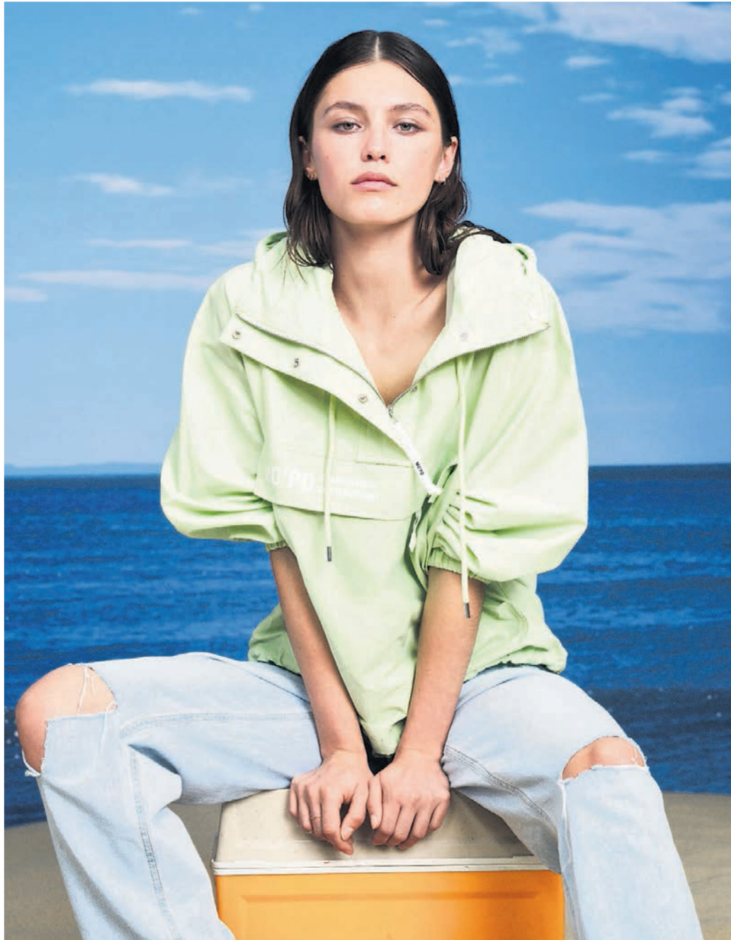
Pastelltöne schmeicheln der Trägerin. Oberteile wie Shirts, Sweatshirts und Hoodies fallen eher quadratisch und gemütlich aus. Auch die Hosen sind nicht zu eng.

Ganz gleich ob Büro oder Stadtbummel: „Hemdblusenkleider sind immer eine perfekte Lösung. Schnell übergezogen sehen sie toll aus.“ Charakteristisch für das Hemdblusenkleid sind der hochgeschlossene Hemdkragen und die durchgehende