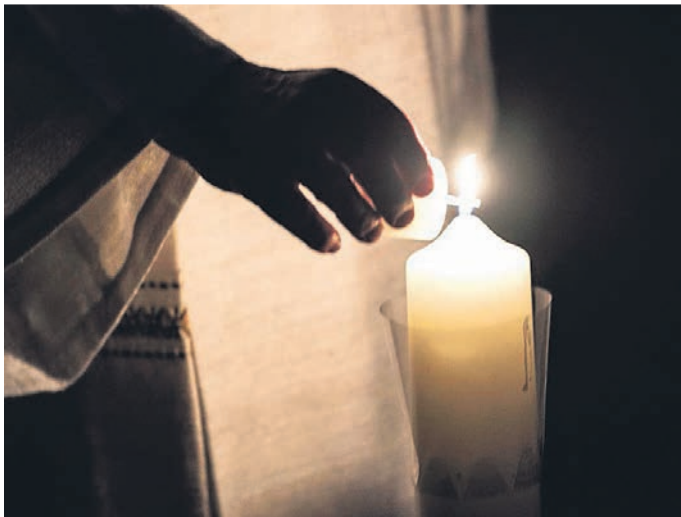
Die Osterkerzen bringen in der Osternacht Licht in die Kirchen.