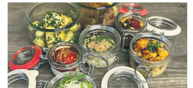
Die GenussBoxen sind eine leckere und unkomplizierte Idee für kleinere Familienfeiern zu Hause.

höchste Qualität in allen Preisklassen. „Breit in der Spitze und spitz in der Breite für sinnliche Weinerfahrungen“, beschreibt es ein Weinkritiker.