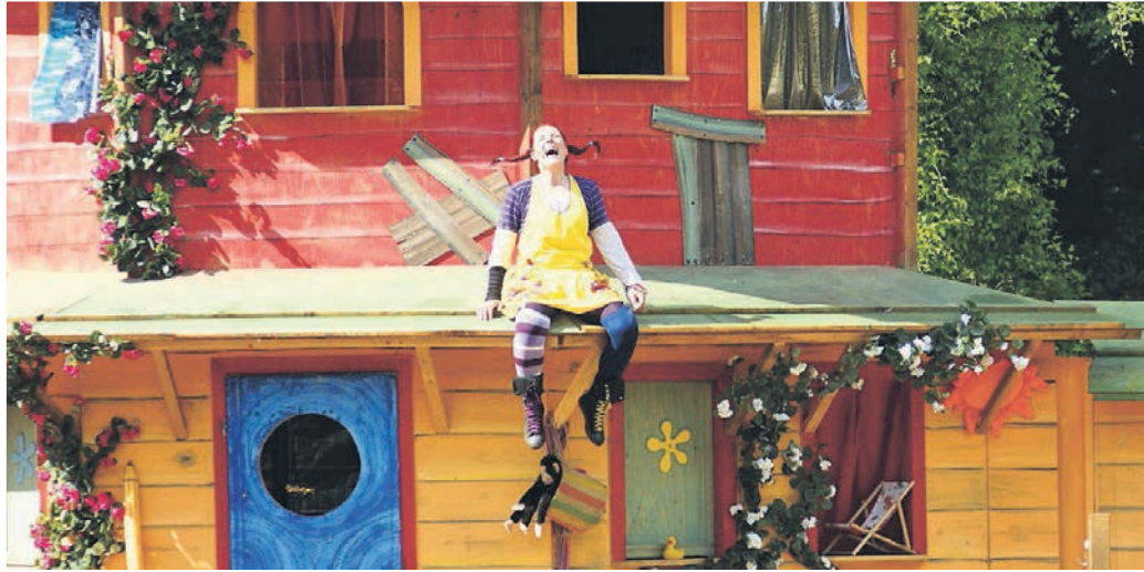
Bei Pippi Langstrumpf geht es lustig zu.