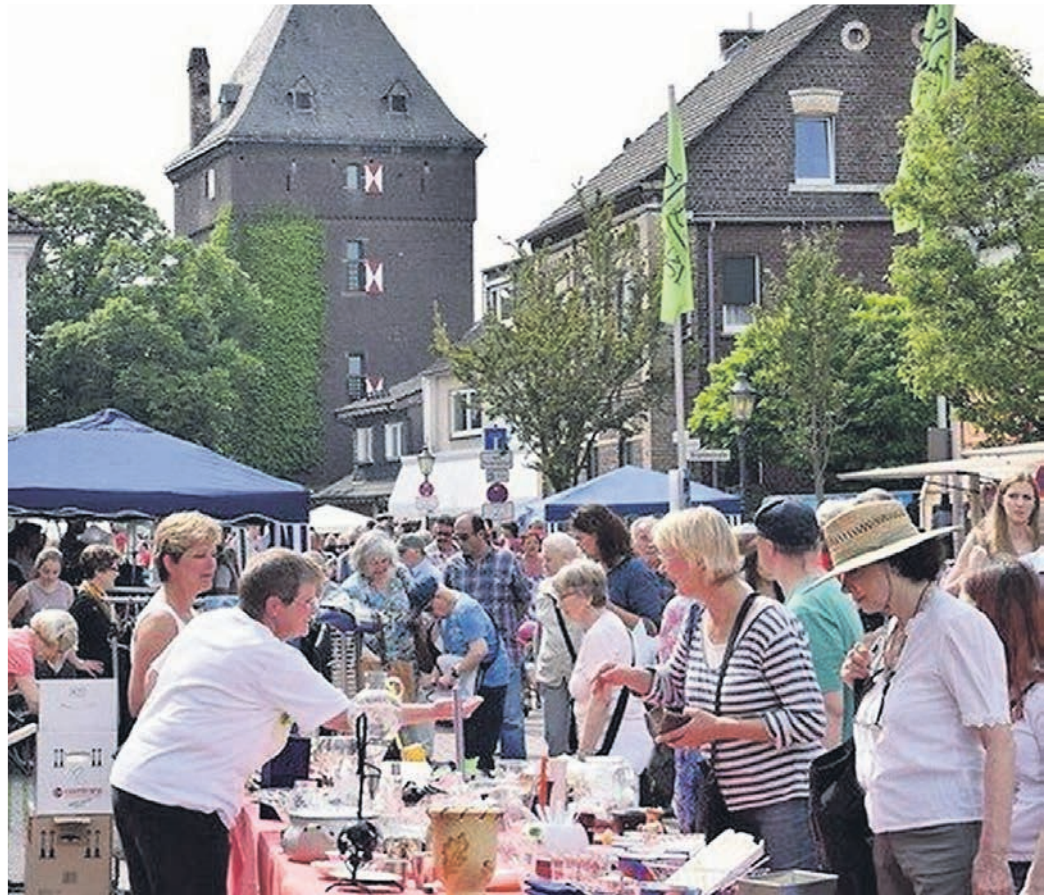
Beim Stadtfest im Monheim findet in der Altstadt auch wieder der Gänselieselmarkt statt.

Vom 10. bis 12. Juni wird das 11. Monheimer Stadtfest gefeiert, diesmal mit dem Thema „Römer“. Das Motto „Veni, vide, gaude!“ bedeutet recht frei übersetzt „Komm, siehe, feiere“. Das passt; schließlich wurde das ehemalige Römerkastell Monheims, „Haus Bürgel“, inzwischen als Teil des Niedergermanischen Limes zum Unesco-Weltkulturerbe. Tagsüber ist es ein familienfreundliches Straßen-