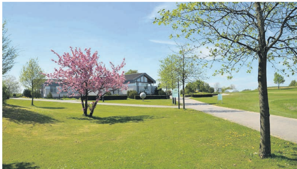
Der Golfclub Mettmann sorgt das ganze Jahr für entspanntes Urlaubsfeeling vor der Haustür.

der. „Nach den ersten Übungen gibt es oftmals kein Zurück und ein Platzreifekurs muss her.“ Dieser kann beim Golfclub Mettmann in Verbindung mit einer zweimonatigen Probemitgliedschaft absolviert werden. In 29 Golfeinheiten zu je 45 Minuten werden die Grundzüge von Technik, Regeln und Etikette vermittelt, für die Dauer des Kurses stellt der Club allen Teilnehmern leihweise einen Schlägersatz