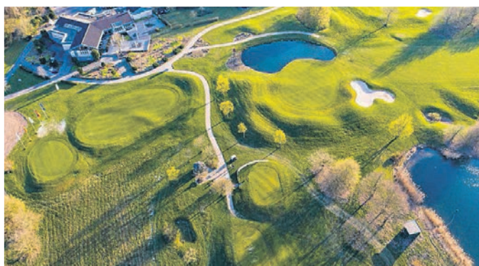
Hügel, Teiche und Sandbunker bieten Herausforderungen.

ders. „Nach den ersten Übungen gibt es oftmals kein Zurück und ein Platzreifekurs muss her.“ Dieser kann beim Golfclub Mettmann in Verbindung mit einer zweimonatigen Probemitgliedschaft absolviert werden. In 29 Golfeinheiten zu je 45 Minuten werden die Grundzüge von Technik, Regeln und Etikette vermittelt, für die Dauer des Kurses stellt der Club allen Teilnehmern leihweise einen Schlägersatz