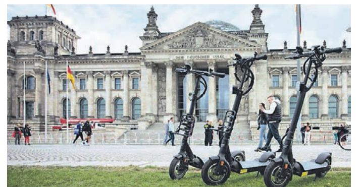
Ob beim Städtetrip oder Messebesuch: Der E-Scooter sorgt für Mobilität.

Dafür hat Achim Wischtukat die passende Lösung. Der Pächter der Minigolfanlage Am Krummenweg in Ratingen bietet ab April hochwertige E-Scooter zum Ausleihen an. Die Geräte vom Hersteller Walberg Urban – Modell Egret Ten – sind klappbar und werden mit Ladegerät und Schloss an die Kunden ausgegeben. „Wir möchten den Leuten Premium-Qualität bieten. Die Fahrzeuge von Egret sind sehr sicher“, betont Wischtukat. Sie können zusammengeklappt einfach transportiert werden und im Hotelzimmer