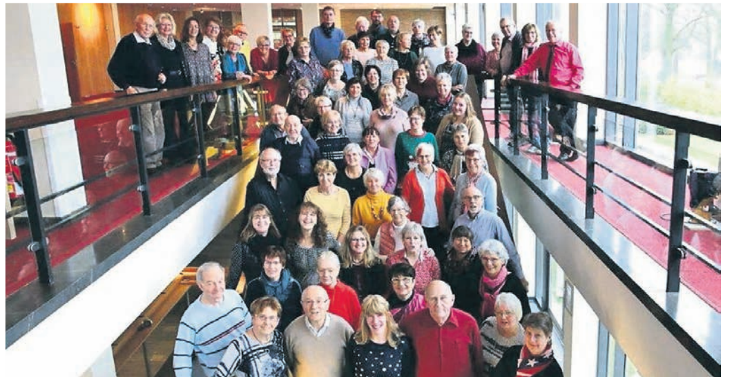
Die Mitglieder der Chorgemeinschaft Aufderhöhe halten zusammen.