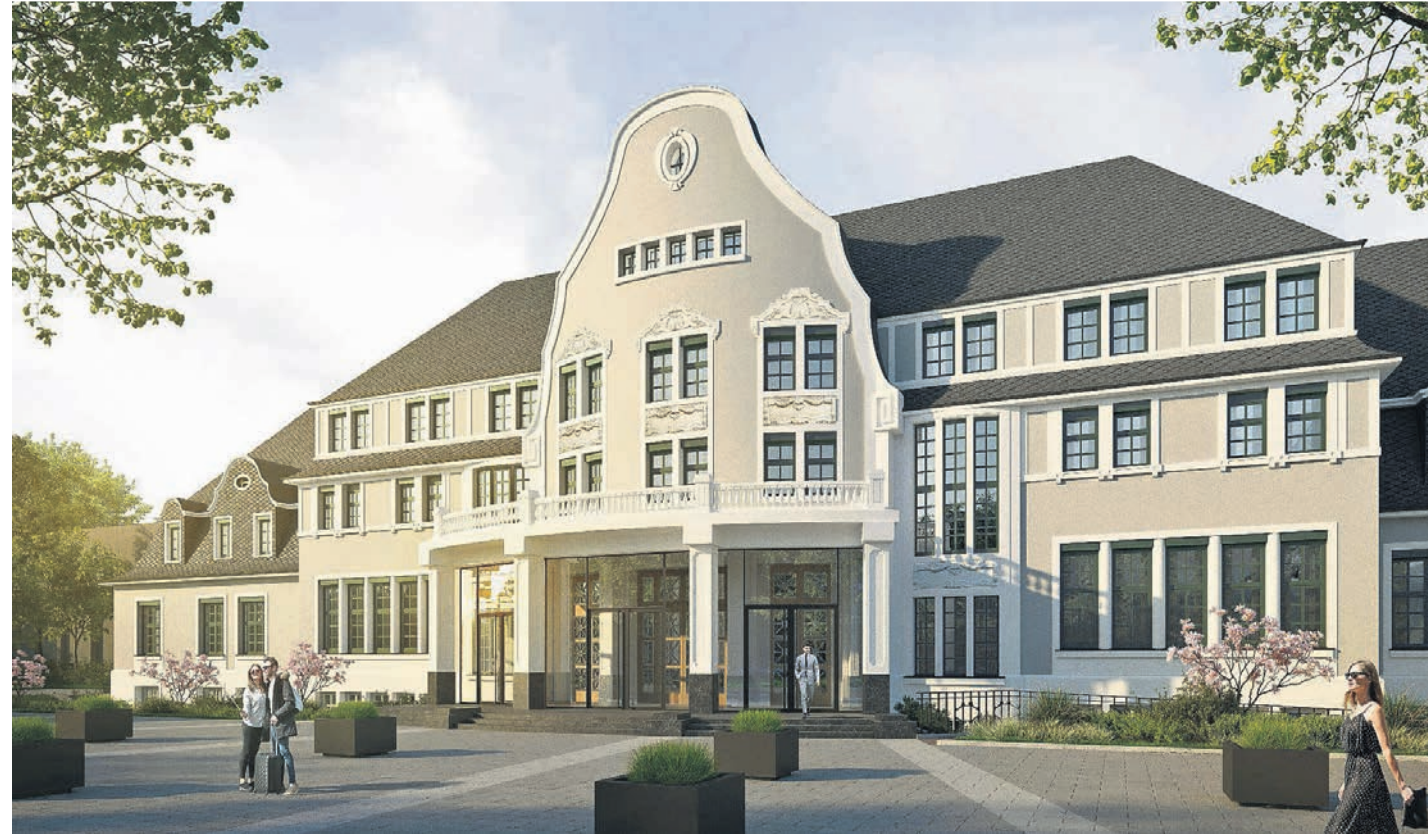
Das Kasino Leverkusen wurde 1913 eröffnet. Die im Jahr 2020 begonnene Sanierung wird in Kürze komplett abgeschlossen sein.

Wer es sich gerne zu Hause oder bei einer Gartenparty gut gehen lassen möchte, und dort mit netten Menschen „lecker essen und trinken will“, dem seien die GenussBoxen des Kasinos Leverkusen empfohlen. In den Lockdowns der Coronazeit geboren, haben sich diese alternativen Angebote einen großen Gästekreis