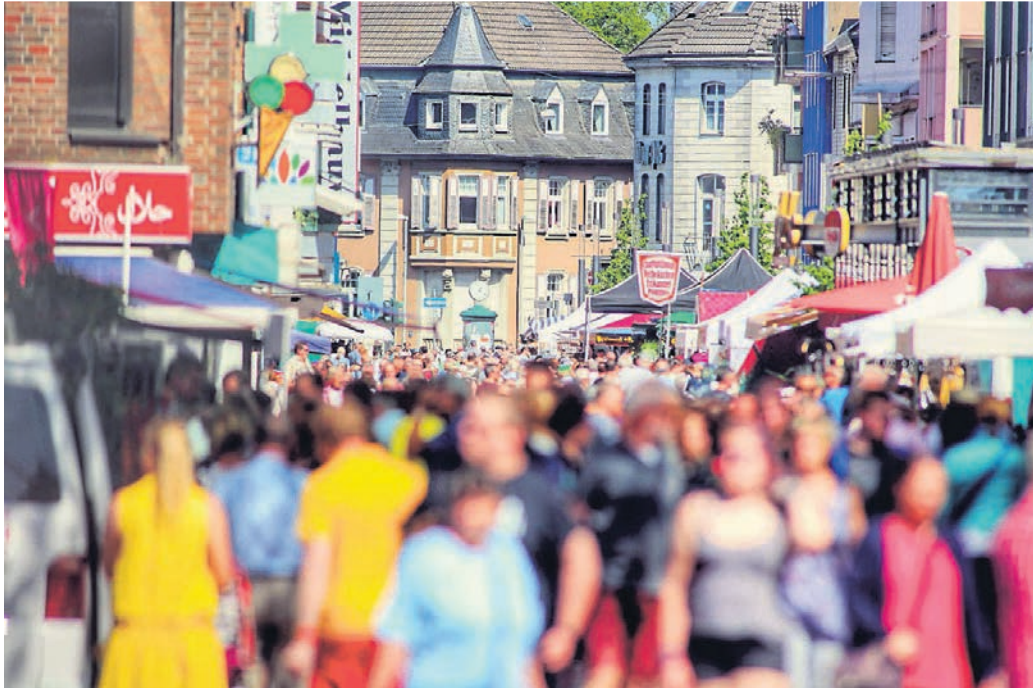
Opladen freut sich auf viele Besucher des Ostermarkts.

Noch ist die Planung nicht ganz abgeschlossen, doch den Startschuss für das Wochenende sollen der Frischemarkt und der Ostermarkt geben, die in der gesamten Fußgängerzone ab Samstagmorgen, 16. April, stattfinden. Ein Teil des Frischemarktes wird wegen der Umbaumaßnahmen voraussichtlich in die Mitte der Fußgängerzone wandern. Dort soll dann am Sonntag und Montag der große Holländer seine exotischen Pflanzen anbieten. Der Blumenmarkt passt zur Frühlingsstimmung und hält jede