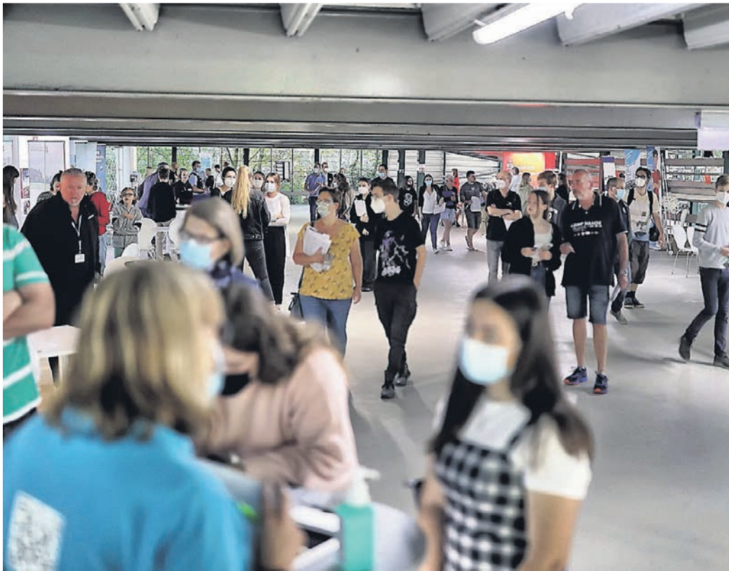
Die Ausbildungs- und Studienbörse in Hilden bringt Schüler und Unternehmen in Kontakt.

Im Leben eines Schülers ist die allergrößte Maxime, einen ordentlichen Schulabschluss zu schaffen. Nach zehn, zwölf oder 13 Jahren, in denen sie die Schulbank gedrückt haben fange erst das echte Leben an, so glauben viele. Nur vergessen sie häufig dabei, dass sie mit ihrem Abschluss in der Tasche auch einen sicheren Hafen mit vorgegebenen Wegen verlassen und sich in die Wellen der beruflichen Weltmeere stürzen – viel zu häufig ohne feste Route. Einen Kompass reicht ihnen dabei seit nunmehr zehn Jahren die Hildener Ausbildungs-