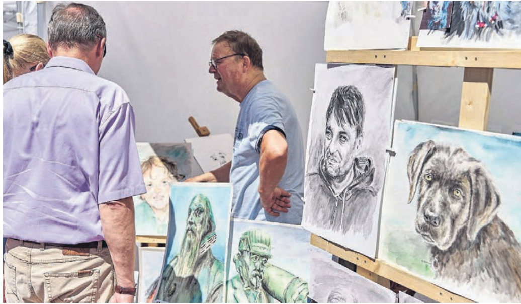
Die Künstlerinnen und Künstler stellen in der Hildener Fußgängerzone ihre Kunstwerke aus.

Von wunderschönen Landschaftsmalereien und Aufnahmen über Porträts und Objektstudien, von Bleistift, Kohle, Öl oder Acryl bis hin zu feinen und ausgefallenen Collagen und Skulpturen aus diversen Materialien, Papier und Pappe, Holz und Metallen gibt es jedes Jahr auf dem Hildener Künstlermarkt viel zu sehen und zu erstehen. Hier zeigt sich eindrucksvoll, dass