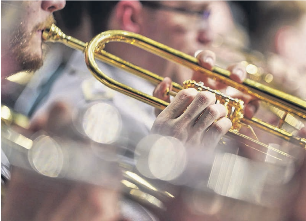
Endlich wieder gemeinsam auf der Bühne: Die Hildener Musikschule feiert ihr Jubiläum mit einem Konzert, bei dem die Musiker endlich wieder gemeinsam spielen.

Es ist ein besonderes Projekt, das durch eine Landesförderung finanziert wird, um die gebeutelten Schüler sprichwörtlich bei der Stange zu halten und zu motivieren. Denn weil die Ensembles der Musikschule seit 2020 nur wenige Wochen proben und dann auch nur in reduzierter Besetzung zusammenkommen konnten, und weil Auftritte und Konzerte abgesagt werden mussten, schwand bei vielen die Begeisterung. Selbst moderner Distanzunterricht am