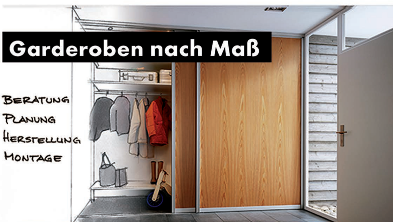
Garderoben nach Maß