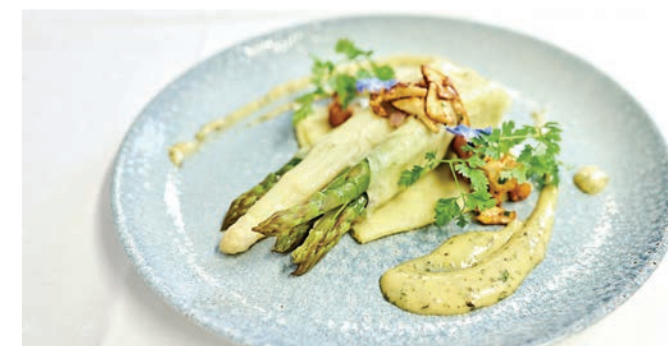
Das Restaurant Löwe verwöhnt bereits seit Herbst 2021 wieder seine Gäste.