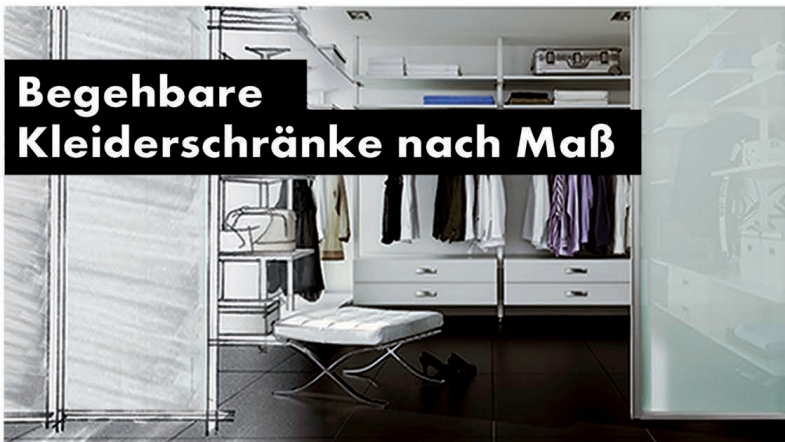
Begehbbare Kleiderschränke nach Maß