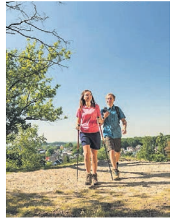
Bei der Wanderwoche findet jeder die passende Tour.

Oftmals direkt vor der eigenen Haustür finden sich zahlreiche interessanten Ziele und kleine Geheimnisse, die nur darauf warten, entdeckt zu werden. Bei der Neanderland-Wanderwoche, die vom 7. bis 15. Mai stattfinden soll, gibt es Angebote für Jung und Alt, Spaziergänger und Wanderprofis. Unter den mehr als 35 Touren mit lokalen Guides findet jeder Interessierte ein für ihn passendes Ziel. Unter anderem sind thematische Rundgänge, Erlebnistouren für