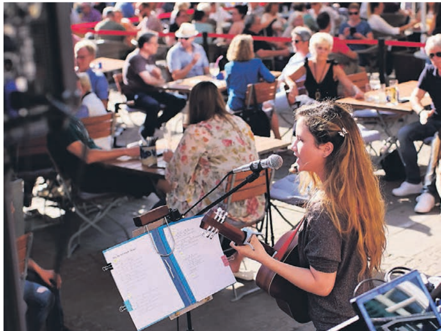
Genießer kommen in Ratingen sowohl kulinarisch als auch musikalisch auf ihre Kosten.

Streetfood-Event und Fischmarkt am gleichen Wochenende.