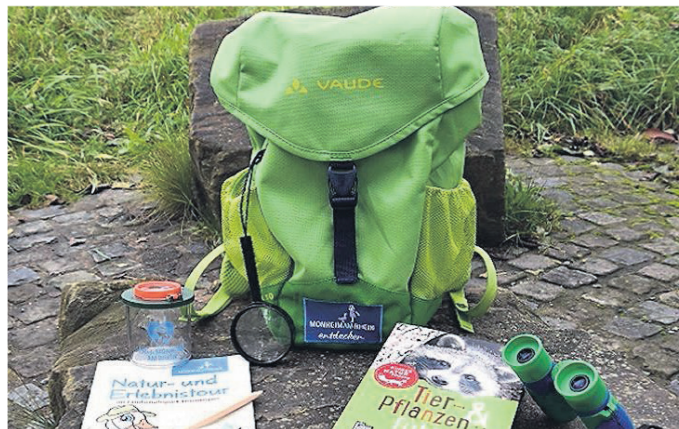
Mit dem Entdecker-rucksack können junge und alte Abenteurer Monheim erkunden.

fest mit vielen kostenfreien Spiel- und Mitmachaktionen und bietet an den Abenden Open-Air-Konzerte mit hochwertigen Bühnenacts.