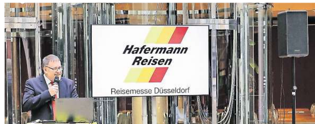
Mit Vorträgen informieren diverse Aussteller im Untergeschoss der Schadow Arkaden.

12.30 Uhr Felix Reisen: Vodice – Sonne und Meer an der dalmatinischen Küste Kroatiens