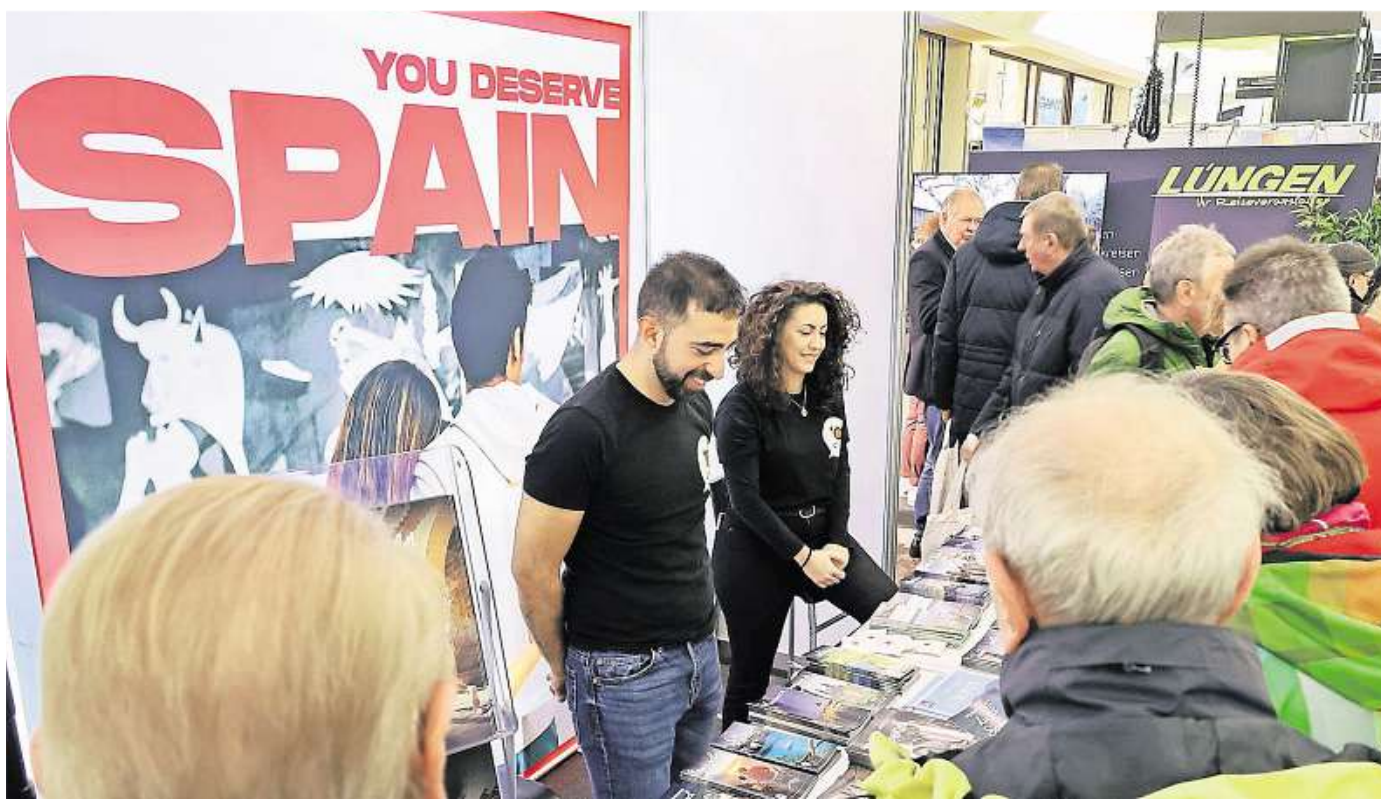
Spanien ist beliebt: Am Stand von Turespaña herrschte schon im vergangenen Jahr reger Andrang.

Die Reisesaison 2025 ist gestartet und damit steht auch die ReiseWelt vor der Tür: Am 16. Februar heißt die Rheinische Post wieder Reiselustige und Interessierte in den Schadow Arkaden willkommen. Über 20 Aussteller informieren über ihr Angebote und stellen spannende Ziele vor: Kroatien, Spanien, Frankreich, Dänemark, Finnland, die Schweiz und Norwegen stehen auf dem Programm für alle, die es in die weite Welt zieht. Wer lieber durch Deutschland reist, kann sich über Städte wie Bad Salzufflen oder Bad Driburg informieren – auch dort kann man Urlaubsfeeling genie-