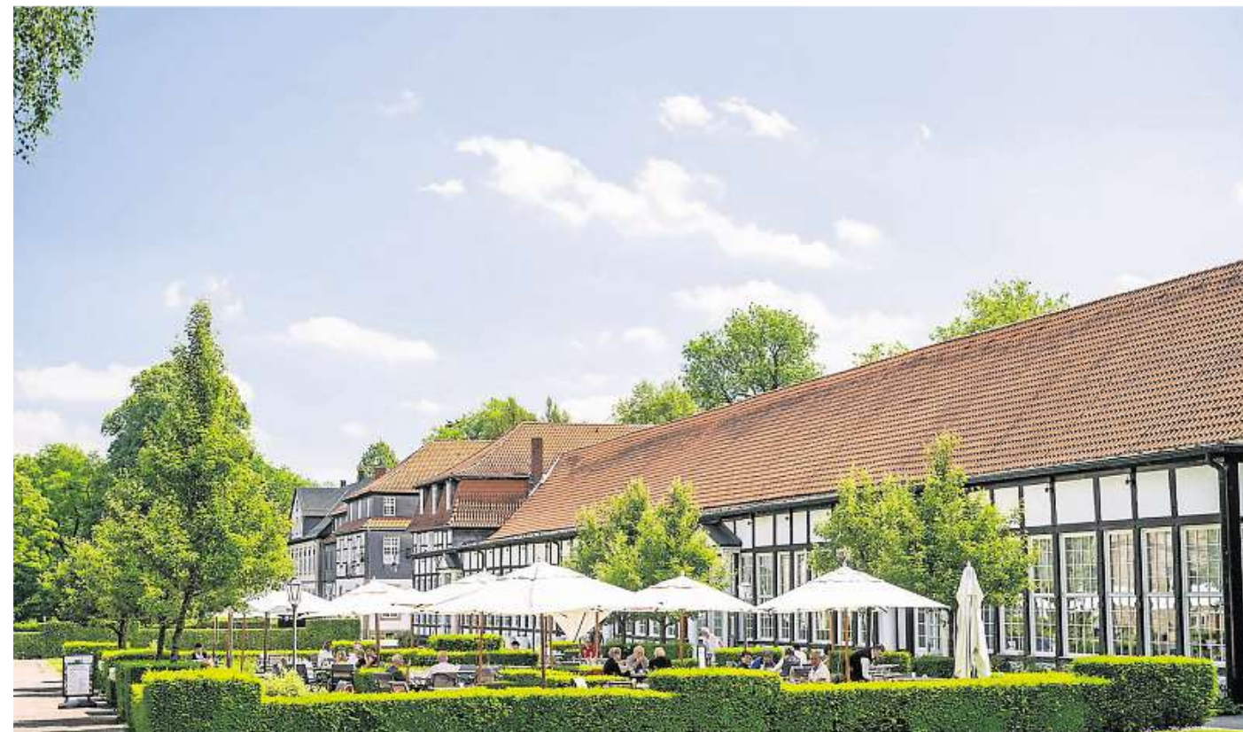
Der Gräfliche Park in Bad Driburg ist ein Refugium für Erholungssuchende. Vertreter des Kurortes stellen alle Facetten von Bad Driburg auf der ReiseWelt 2025 vor.

Bad Lippspringe Bad Lippspringe ist die einzige Stadt in NRW, die die Prädikate „Heilklimatischer Kurort der Premium Class“ und „Staatlich anerkanntes Heilbad“ führen darf. Besuchen Sie die preisgekrönte Gartenschau mit imposan-