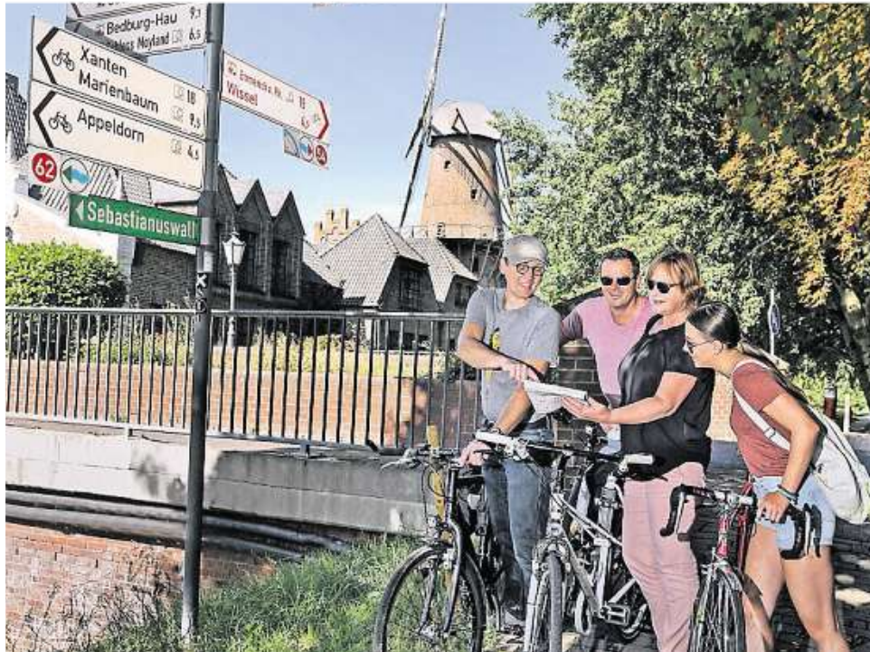
Mit dem Rad lässt sich der Kreis Kleve gut erkunden.

Das Traditionsunternehmen ist Spezialist für hochwertige Gruppenreisen. In seinem umfangreichen Angebot finden sich Musik- und Kulturreisen, Rundreisen, Städtereisen, Reisen ans Meer und in die Berge, kulinarische Erlebnisse und besondere Events wie zum Beispiel die Bregenzer Festspiele oder eine Operngala mit Startenor Jonas Kaufmann in Regensburg. Besonders bequem: bei vielen Reisen kann gegen einen kleinen