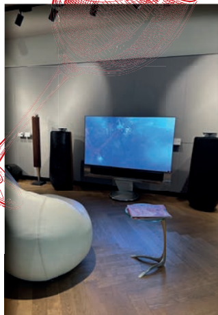
Bang & Olufsen, KÖ 61 GmbH