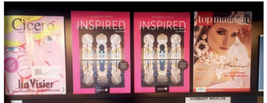
Wirtschaftsclub Düsseldorf GmbH