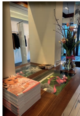
HALFMANN Pelzmanufaktur GmbH