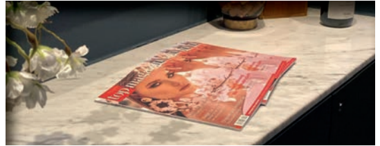
Weinhandlung 20Grad Restobar