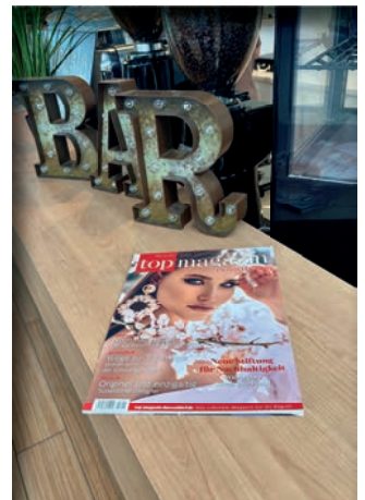
Volkswagen Zentrum Düsseldorf