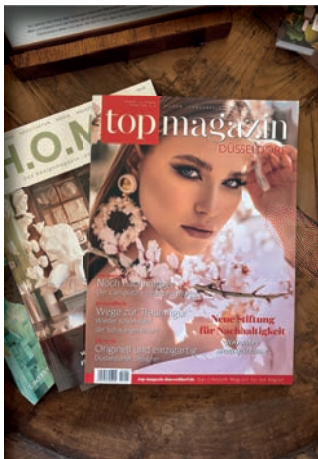
Vabali Spa Düsseldorf GmbH & Co. KG