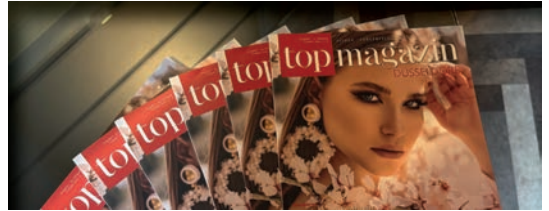
Sheraton Düsseldorf Airport Hotel