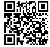
Der Rheinische Post-TikTok-Kanal